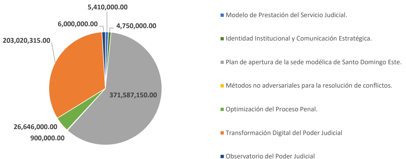
Gráfico No. 9: Distribución presupuestaria de los proyectos por Área Responsable