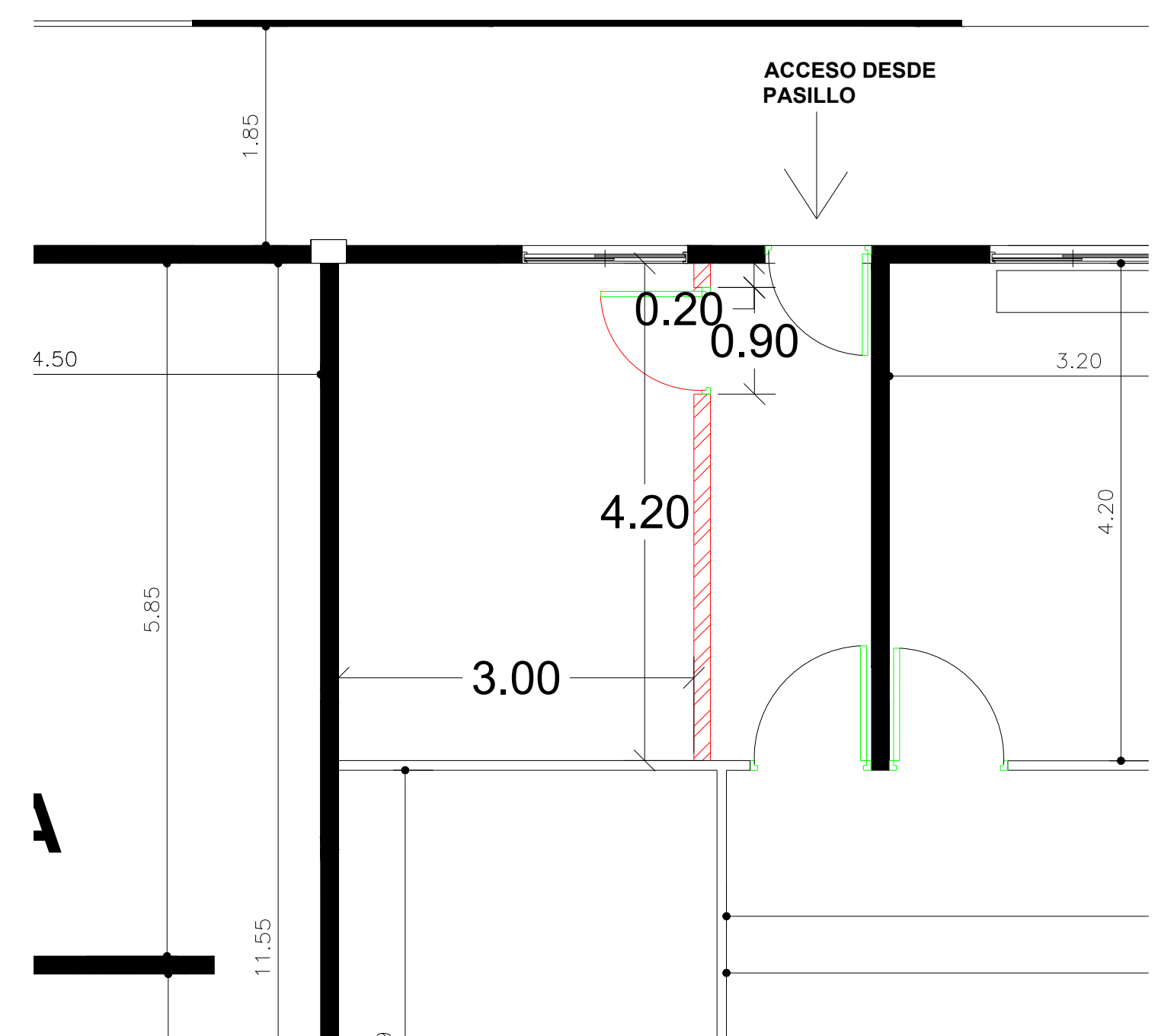
PLANTA PROPUESTA PROPUESTA CCN