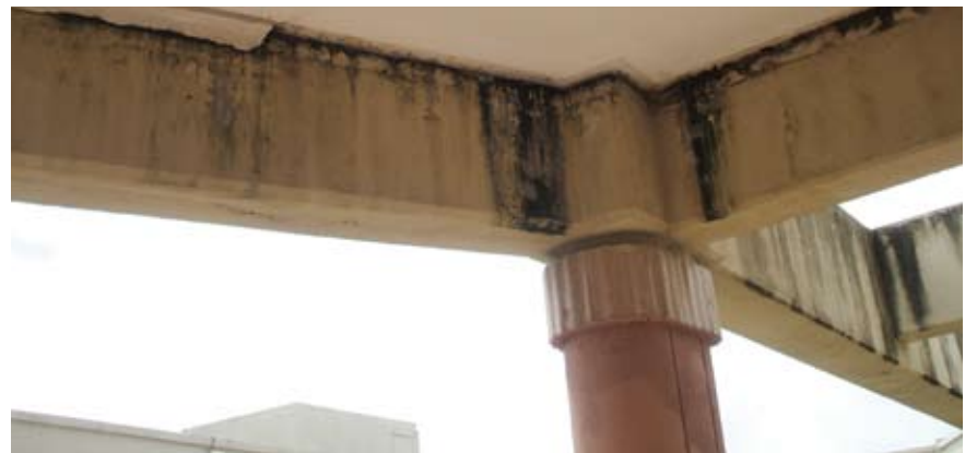
Palacio de Justicia de Santiago - ANTES