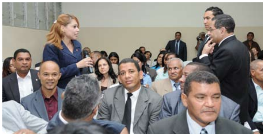
Cada juez externó con soltura las insuficiencias y dificultades que enfrentan diariamente para ejercer sus labores.