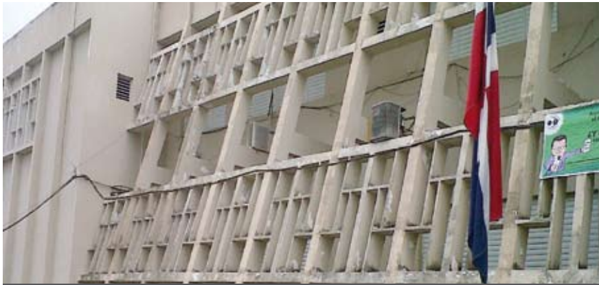
Palacio de Justicia de Montecristi - ANTES

En el Este del país, también se hicieron los levantamientos para los palacios de Justicia de El Seibo y Boca Chica, juzgados de Paz de Los Llanos, Ramón Santana y de la Primera Circunscripción de la provincia Santo Domingo.