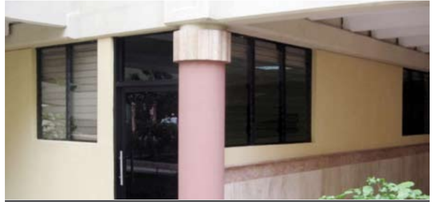
Palacio de Justicia de Santiago - DESPUÉS

Desde el inicio de las visitas a los Departamentos Judiciales, el Departamento de Ingeniería del Poder Judicial empezó a remodelar y reparar todos los palacios de justicia, juzgados de paz y tribunales especiales, como son los de niños, niñas y adolescentes y de tránsito, así como salas de entrevistas, los Modelos de Gestión de Despachos Judiciales, entre otras oficinas.