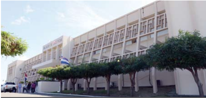
Palacio de Justicia de Montecristi - DESPUÉS