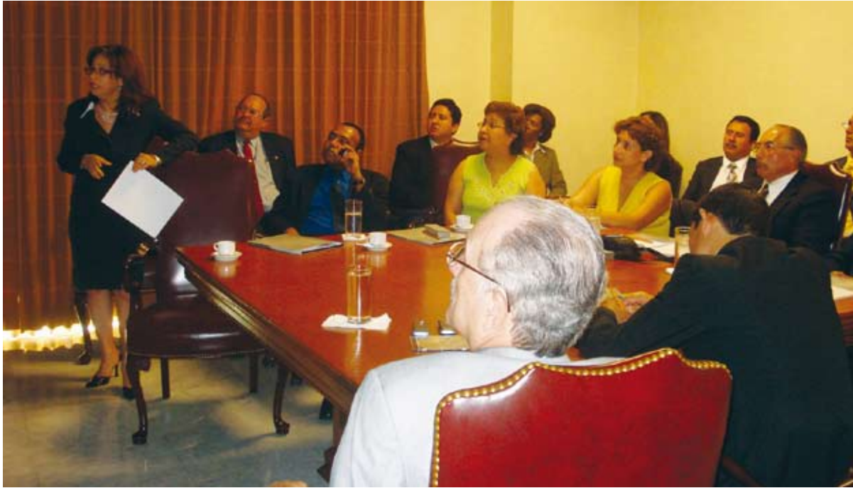
Jueces de Guatemala que visitaron la Suprema Corte de Justicia se reunieron con técnicos y encargados departamentales con quienes intercambiaron experiencias de los proyectos implementados por el Poder Judicial dominicano.