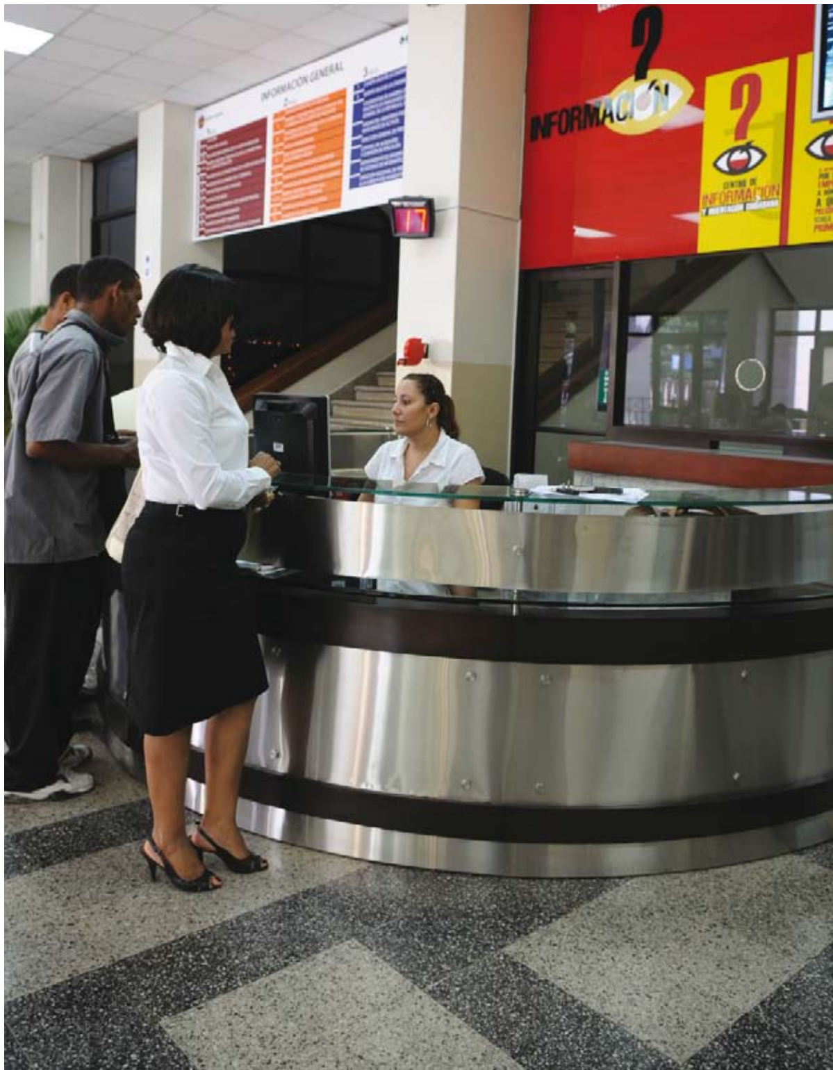
Centro de Información y Orientación Ciudadana (CIOC), ubicado en el Palacio de Justicia de la Corte de Apelación del Distrito Nacional.

personal que labora en las unidades especializadas, que interactúan en el funcionamiento del nuevo modelo, como las de Recepción y Atención a Usuarios, Gestión de Audiencias, Citaciones y Comunicaciones Judiciales y de Soporte a Jueces, Unidades de Servicios de la Instrucción, entre otras.