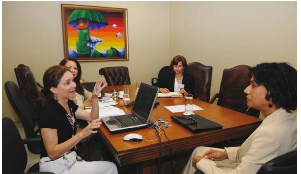
Reunión técnica de trabajo.

Actualmente, esta División trabaja en la actualización de las líneas estratégicas del Poder Judicial dominicano para los próximos cinco años, así como en un proyecto de mejora del acceso a la justicia penal, enfocándose en dos aspectos fundamentales: la planificación institucional y la implementación del Modelo de Gestión de Despacho Penal en el departamento judicial de San Juan de la Maguana, apoyado por la Agencia Española de Cooperación Internacional para el Desarrollo (AECID).