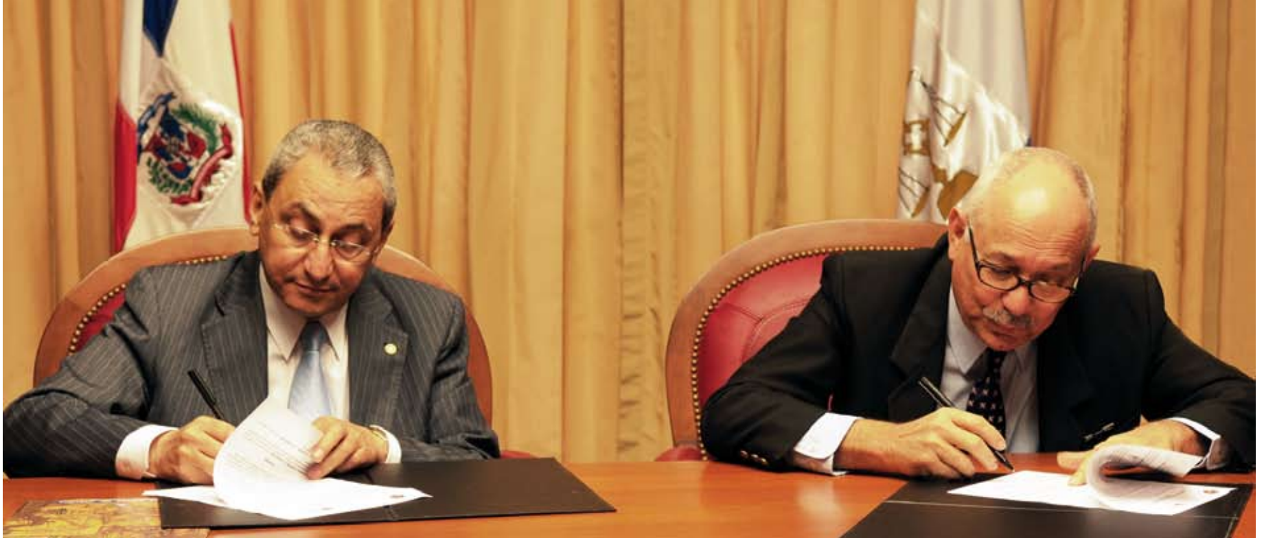
El magistrado presidente de la Suprema Corte de Justicia, doctor Jorge A. Subero Isa y por el Poder Ejecutivo, el consultor jurídico, doctor Abel Rodríguez del Orbe, firmaron un acuerdo de fortalecimiento y cooperación interinstitucional con el objetivo de intercambiar informaciones para fortalecer ambas entidades a fin de proporcionar a la ciudadanía, de manera actualizada y rápida, todas las decisiones jurisdiccionales, administrativas y relativas a los aspectos legislativos.

Tanto en el plano nacional como en el internacional, en el 2008, el Poder Judicial fortaleció la cooperación y los contactos con diversas instituciones, con las cuales compartió los avances logrados en el sistema judicial dominicano, además de firmar convenios para desarrollar acciones en el sistema de justicia en el ámbito regional.