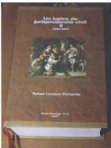
Un Lustró de Jurisprudencia Civil II.

La puesta en circulación tuvo lugar en el auditorio de la Suprema Corte de Justicia.