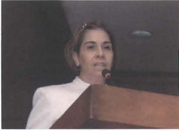
Magistrada Eglys Margarita Esmurdoc.

Dos magistradas de la Suprema Corte de Justicia abogaron porque hombres y mujeres tengan iguales oportunidades en las decisiones judiciales y en la prestación de servicios públicos, a fin de obtener una visión más integral de los diferentes aspectos relacionados con la problemática de la mujer.