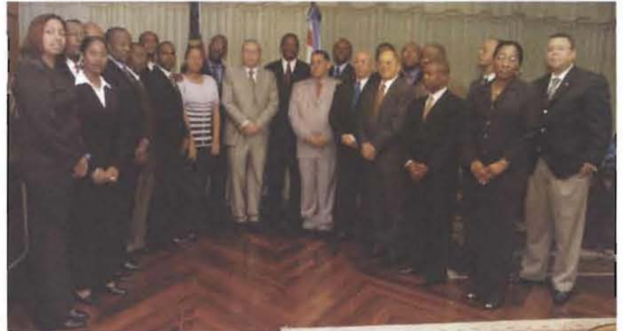
Abogados de Haití visitaron al Magistrado Presidente del Suprema Corte de Justicia.