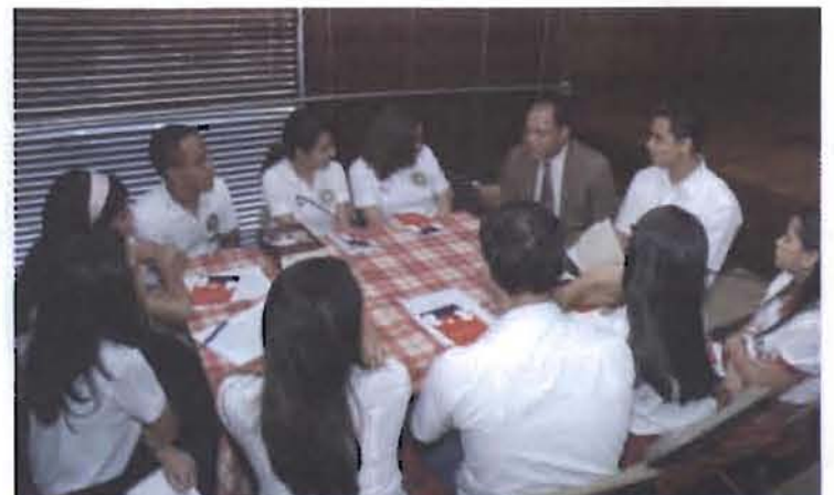
Los estudiantes recibieron orientaciones por parte de jueces de distintas jurisdicciones.

Consideraron que las autoridades no cumplen con los preceptos fundamentales de la Constitución, entre ellas la educación, derecho a la vida, la salud y la vivienda.