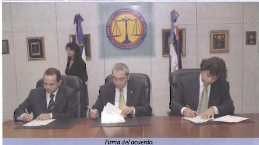
Firma del acuerdo.

La Suprema Corte de Justicia y la Secretaría de Estado de la Juventud suscribieron un convenio para fomentar de manera conjunta la aplicación y difusión de los derechos de los jóvenes en nuestro país.