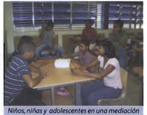
Niños, niñas y adolescentes en una mediación escolar.

Además tiene como proyección la instalación de un Centro en la provincia Santo Domingo.