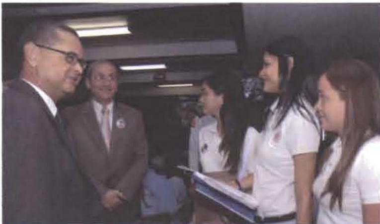
El magistrado Jorge A. Subero Isa conversa con varios estudiantes que participaron en el evento y observa el juez Manuel Alexis Read.

Cientos de jóvenes adolescentes de 20 escuelas y colegios del Distrito Nacional destacaron la importancia de los artículos 8 y 9 de la Constitución de la República, sobre los derechos y deberes ciudadanos, durante un acto celebrado en el auditorio de la Suprema Corte de Justicia, en ocasión del 163 aniversario de nuestra Carta Magna.