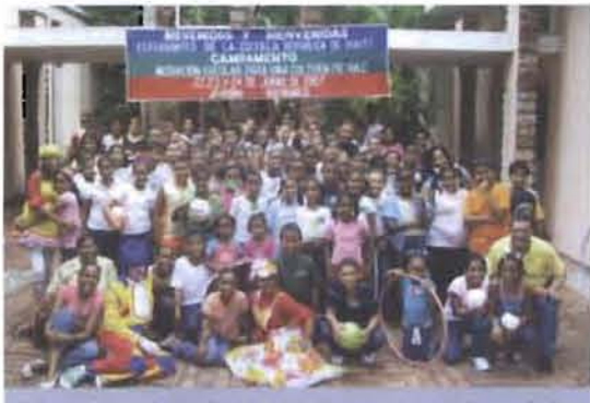
Campamento Mediación Escolar por una Cultura de Paz.

El Centro de Mediación Familiar, una dependencia de la Dirección de Niñez, Adolescencia y Familia, del Poder Judicial, recibió en este año 2007, 295 solicitudes de mediación procedentes de distintos tribunales del país.