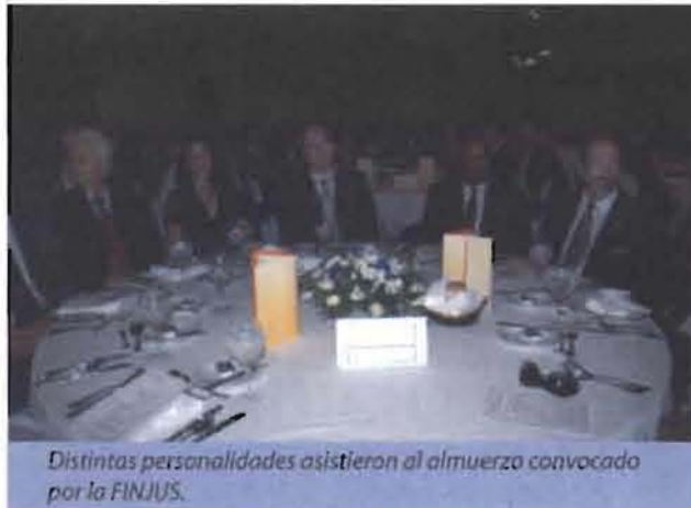
Distintas personalidades asistieron al almuerzo convocado por la FINJUS.

"La primera Ola de Reforma Judicial de la República Dominicana, que como dijimos se inició teóricamente en el año 1994 con la reforma constitucional de ese año, y que se puso en práctica en 1997, ya se agotó al lograrse la independencia del Poder Judicial, y si queremos seguir avanzando y lograr las metas trazadas, es preciso repensar el proceso de reforma judicial en nuestro país", concluyó el Magistrado en su conferencia del hotel Hilton, evento que contó con la presencia de la primera dama Margarita Cedeño de Fernández y los jueces del alto tribunal.