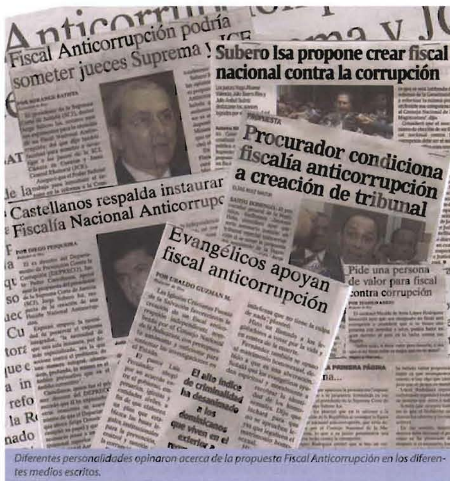
Diferentes personalidades opinaron acerca de la propuesta Fiscal Anticorrupción en los diferentes medios escritos.

"De todas maneras, ese tipo de propuesta es interesante porque enriquece el debate y todos los sectores de la sociedad. Tienen la oportunidad de opinar, tanto la sociedad civil, los abogados, los diferentes estamentos del Estado", opinó previamente el procurador Radhamés Jiménez Peña.