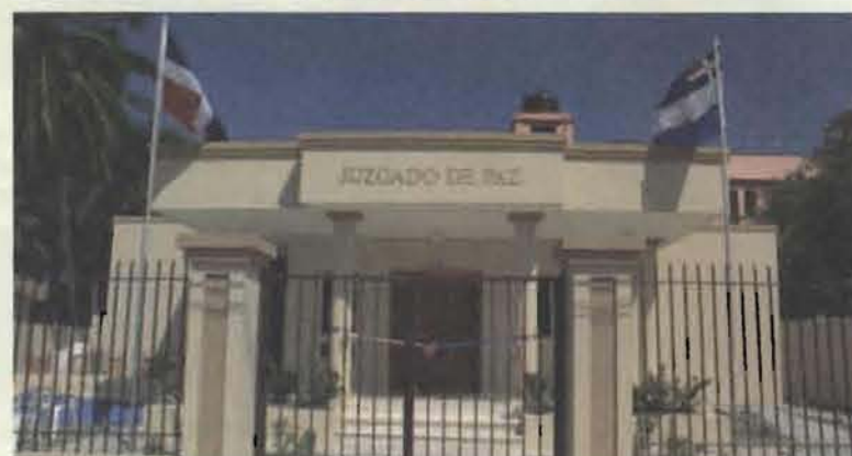
Juzgado de Paz de Río San Juan