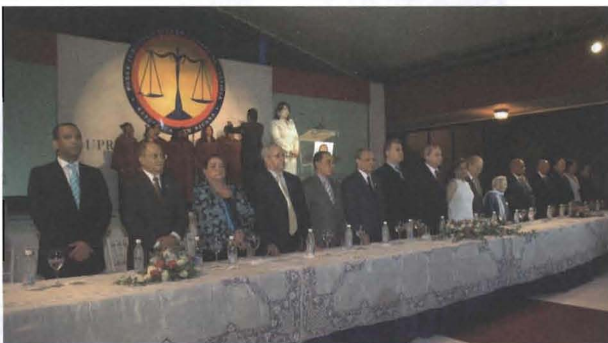
Mesa principal del acto de inauguración de la Jurisdicción Inmobiliaria.

La inauguración formó parte de los actos conmemorativos al "Décimo Aniversario" de la designación de los actuales jueces de la Suprema Corte de Justicia, y el fin de un ciclo del proceso de reforma a través del Programa de Modernización de la Jurisdicción de Tierras (PMJT), que se inició en el año 2000.