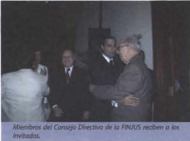
Miembros del Consejo Directivo de la FINJUS reciben a los invitados.