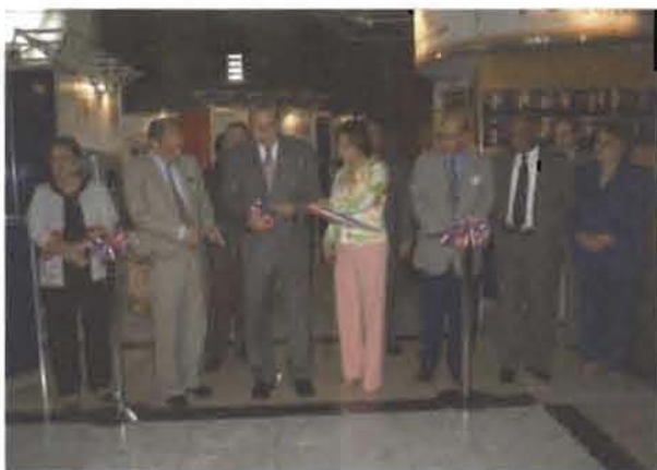
Inauguración de Expo Décimo Aniversario.

Cada momento de la conmemoración tuvo de espe-