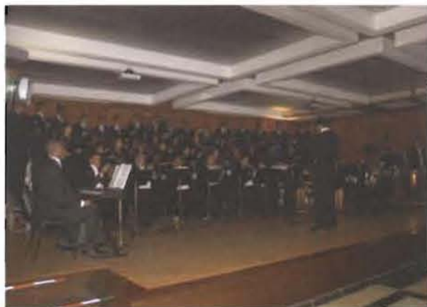
El Coro del Poder Judicial brindó un Gran Concierto de Gala con motivo del aniversario.

cial la presencia de distinguidas personalidades como el Presidente y el Vicepresidente de la República, la Primera Dama, el Procurador General de la República, el Consultor Jurídico del Poder Ejecutivo, dirigentes polí-