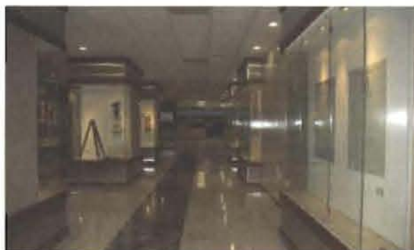
Exhibición ubicada en la entrada principal de la Jurisdicción Inmobiliaria donde se muestran equipos antiguos de tránsito o teodolitos y modernos aparatos como GPS y estación total usados por los agrimensores, una muestra de los títulos que se otorgaban y la nueva papelería de seguridad aprobada por la actual Ley 108-05.

corís e Higüey, así como la automatización del proceso de información en las jurisdicciones de tierras.