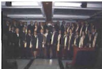
Grupo de defensores públicos graduados.

La Escuela Nacional de la Judicatura graduó este jueves 9 de agosto 38 nuevos defensores públicos, 61 jueces de formación continua y 13 auxiliares judiciales, en un acto que se llevó a cabo en el Auditorio de la Suprema Corte de Justicia.