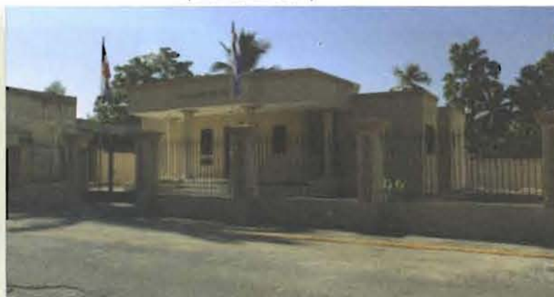
Juzgado de Paz de Los Llanos

Agregó que la entrega de estos tribunales a esas comunidades significa orgullo y alegría para cada una, porque con ello se consolida la institucionalidad y el progreso sostenido que conducirán a una justicia rápida, digna y de calidad para los ciudadanos.