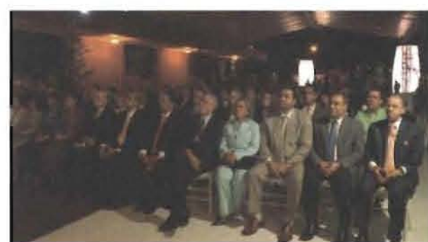
Parte de las personalidades que asistieron al evento.

Quinto, desarrollo de tecnologías que facilitan el acceso del público a la información sobre los derechos reales inmobiliarios que se encuentran registrados.