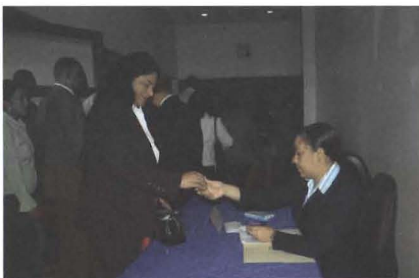
Abogados se inscriben para optar por notaría