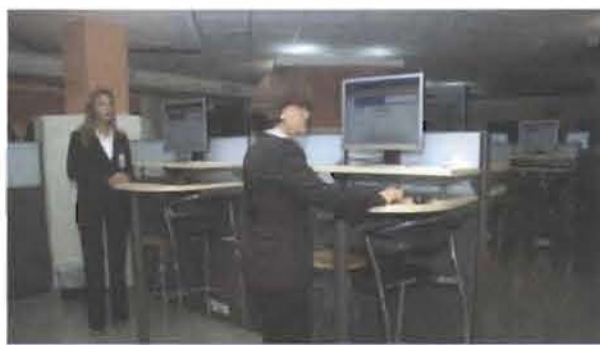
Sala de Consultas del Registro de Títulos.

Siete años de trabajo del PMJT reformaron casi nueve décadas de la anterior Ley 1542 de Registro de Tierras del año 1947, cuyos orígenes se remontan a la Orden Ejecutiva 511 del año 1920, sustituida, por la Ley 108-05 de Registro Inmobiliario con la cual se estableció un nuevo modelo