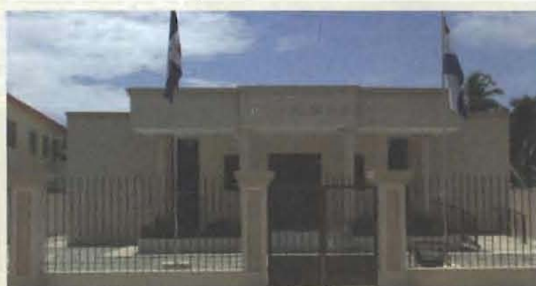
Juzgado de Paz de Nizao