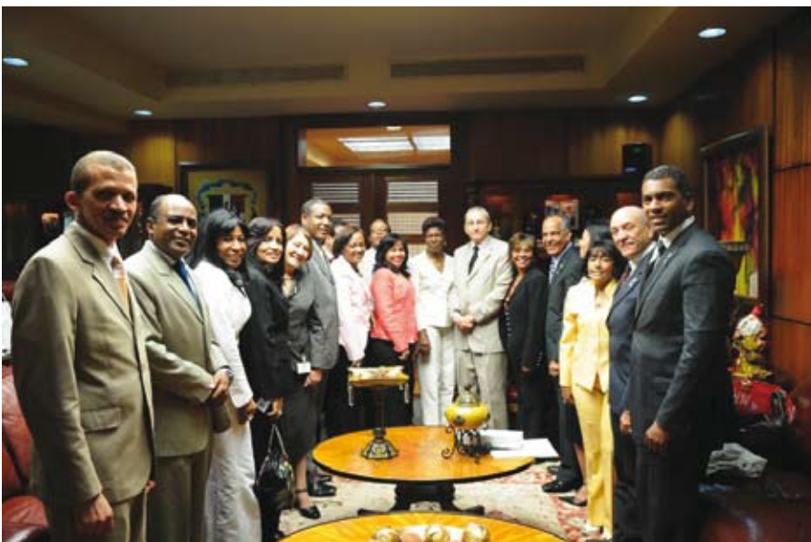
Presidente de la Suprema Corte de Justicia recibió Comisión Permanente de Equidad de Género de la Cámara de Diputados.