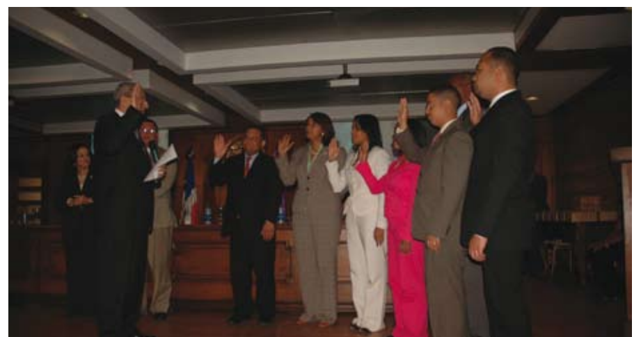
Juramentación de la Unidad de Integridad (UII) de la Defensa Pública.

Actividades internacionales: La ONDP en el año 2008 participó en diversos congresos y eventos internacionales. Resaltándose que por segunda oportunidad consecutiva la Defensa Pública de la República Dominicana fue seleccionada como coordinadora para el Caribe de la Asociación Interamericana de Defensorías Públicas (AIDEP), que aglutina a todos los países de América, donde existen sistemas de defensorías públicas.