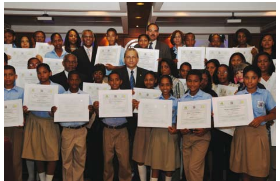
La Suprema Corte de Justicia, la Secretaría de Estado de Educación y la Fundación Institucionalidad y Justicia, entregaron 42 certificados de Mediadores Escolares a 20 profesores y 22 estudiantes de la Escuela República de Haití, para mediar los conflictos que se susciten en los centros de estudios.

Proceso de desarrollo e implantación del proyecto "Centros de Entrevistas a Niños, Niñas y Adolescentes" (víctimas o testigos de delitos penales). El primero a ponerse en funcionamiento próximamente estará instalado en la sede de la Dirección de Niñez, Adolescencia y Familia, gracias a los auspicios de la Embajada de Gran Bretaña e Irlanda del Norte. Se tiene proyectada la instalación de los equipos y el entrenamiento para la segunda semana de enero y su puesta en funcionamiento en el primer trimestre del año 2009; dará servicio a dos distritos judiciales: Distrito Nacional y Santo Domingo.