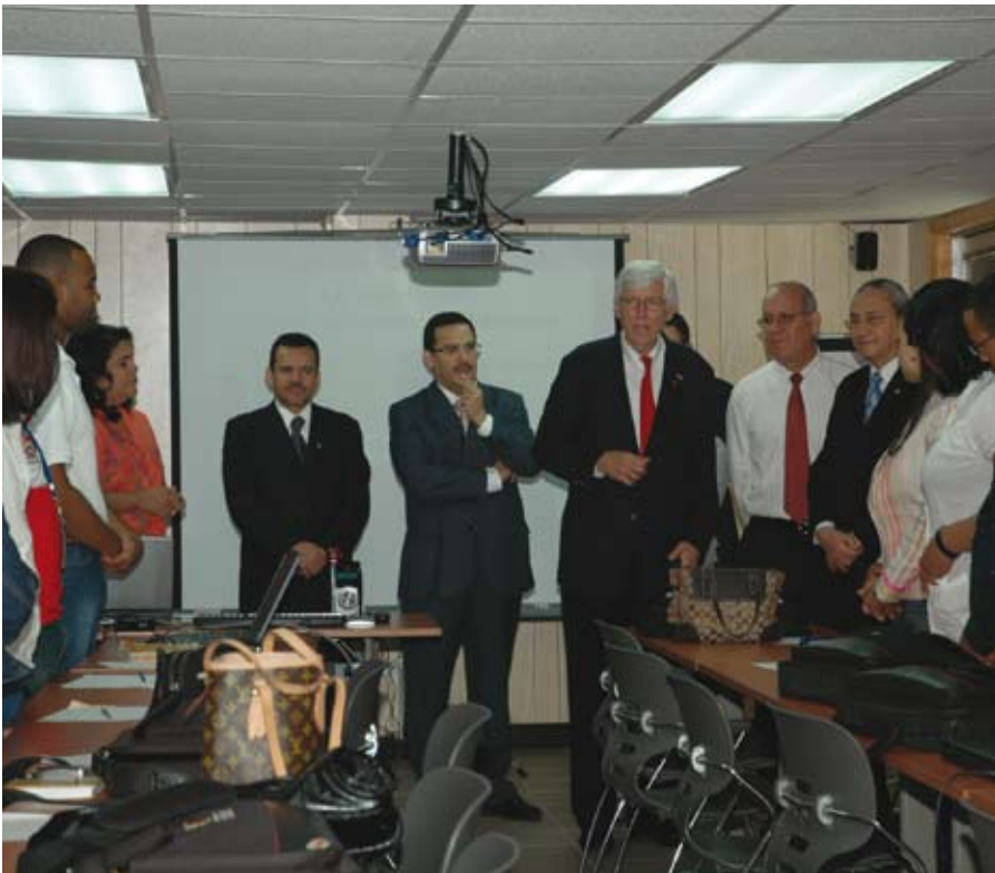
El embajador de los Estados Unidos, Robert Fannin, visitó la Escuela Nacional de la Judicatura.