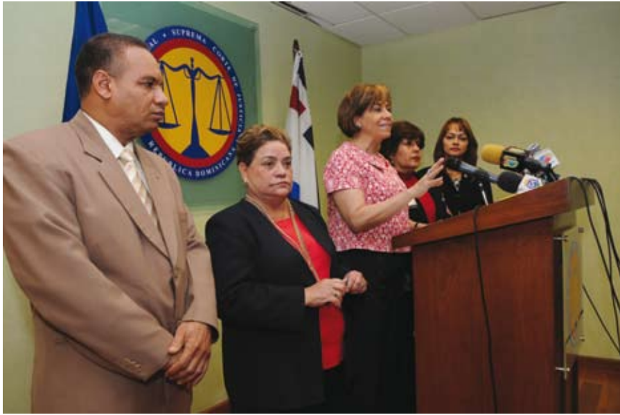
Miembros de la Comisión de Igualdad de Género del Poder Judicial

La Dirección de Niñez, Adolescencia y Familia, así como la Comisión para la Igualdad de Género, órganos encargados de implementar políticas institucionales tendientes a garantizar la protección de los derechos de los menores de edad, de la mujer y el fortalecimiento de las familias y de impulsar la puesta en funcionamiento de los tribunales de niños, niñas y adolescentes, logró en este año la ejecución de las actividades siguientes: