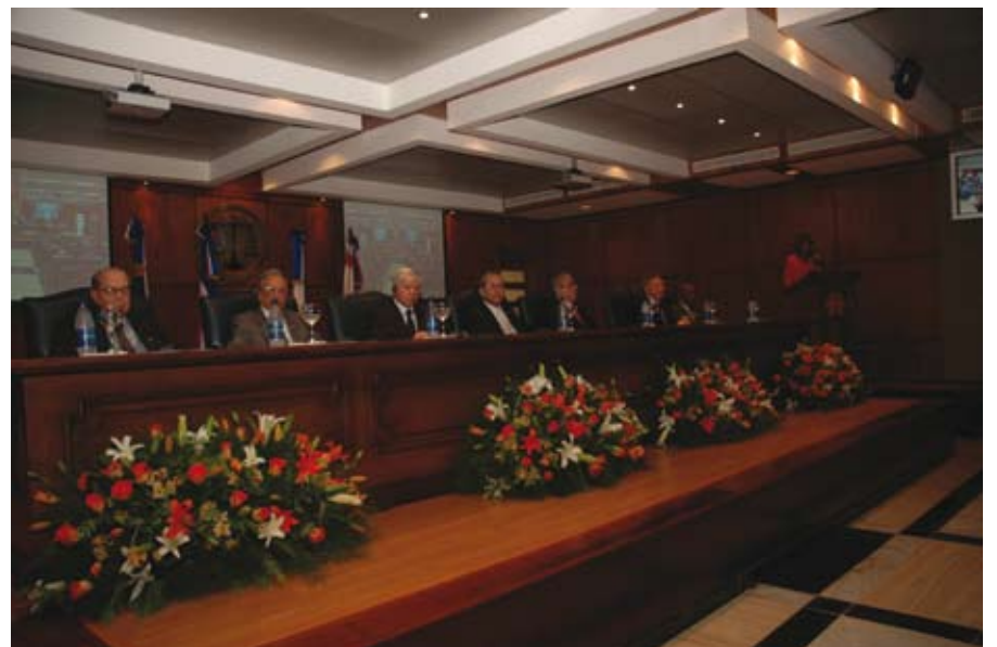
La Suprema Corte de Justicia celebró el "Encuentro Ruso-Centroamericano", con la participación de presidentes de Cortes Supremas de Rusia, El Salvador y República Dominicana.