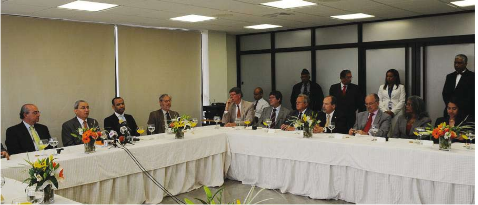
La Suprema Corte de Justicia conjuntamente con el Programa de Consolidación de la Jurisdicción Inmobiliaria realizó un desayuno-presentación con diplomáticos acreditados en el país y autoridades del Banco Interamericano de Desarrollo (BID).