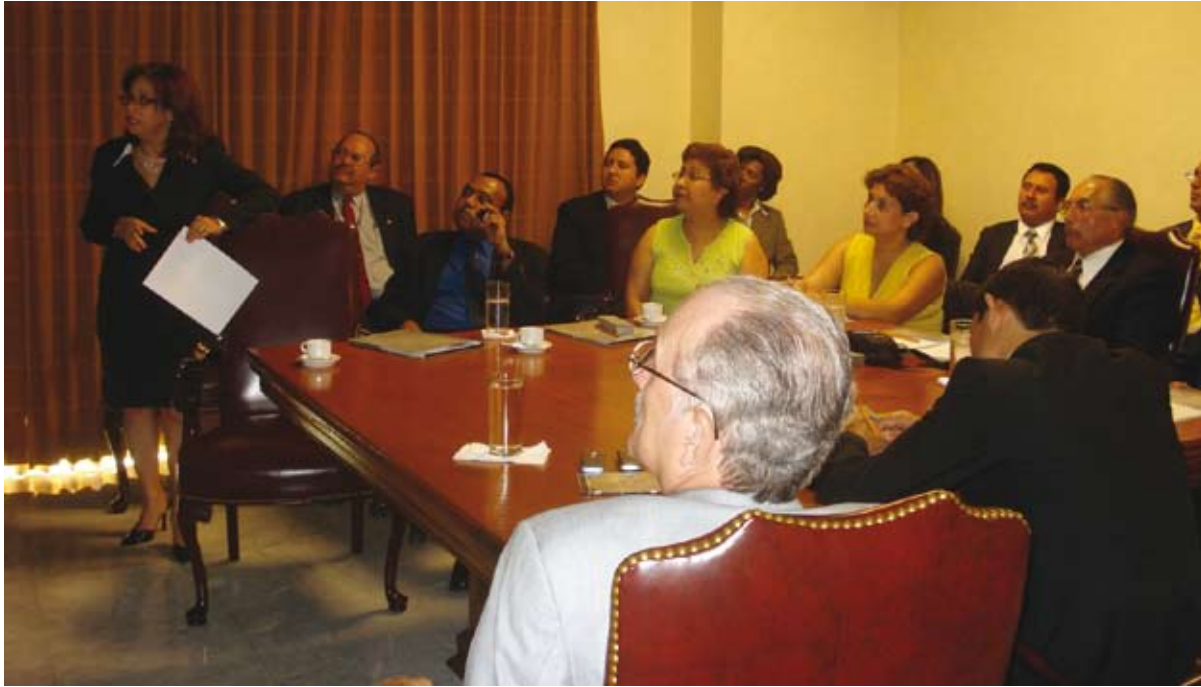
Jueces de Guatemala que visitaron la Suprema Corte de Justicia se reunieron con técnicos y encargados departamentales con quienes intercambiaron experiencias de los proyectos implementados por el Poder Judicial dominicano.