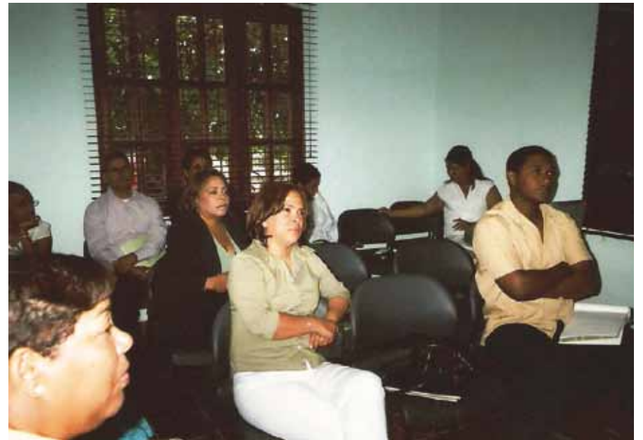
Parte del equipo que participó en el taller de sensibilización sobre el servicio que ofrece el Centro de Mediación Familiar del Poder Judicial.

Entre las instituciones de apoyo al servicio que ofrece el Centro de Mediación Familiar están: tribunales de niños, niñas y adolescentes; Patronato de Ayuda a Mujeres Maltratadas (PACAM); fiscalía del Distrito Nacional; salas para Asuntos de Familia; Centro Dominicano de Asesoría e Investigaciones Legales (CEDAIL); Fundación Institucionalidad y Justicia (FINJUS); Participación Ciudadana, Centro de Asesoría Legal para la Mujer (CENSEL), Pastoral Juvenil y otras.