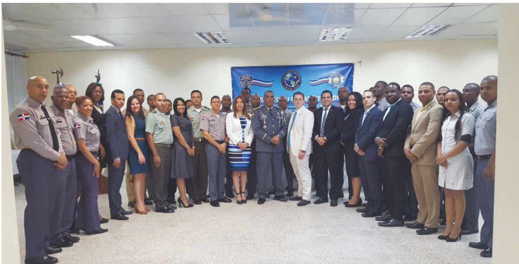
Jueces y funcionarios de Inspectoría del Poder Judicial junto a otros participantes del taller de capacitación.