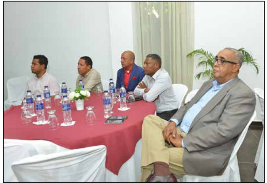
Comunicadores de la región sur escuchan atentos la conferencia.