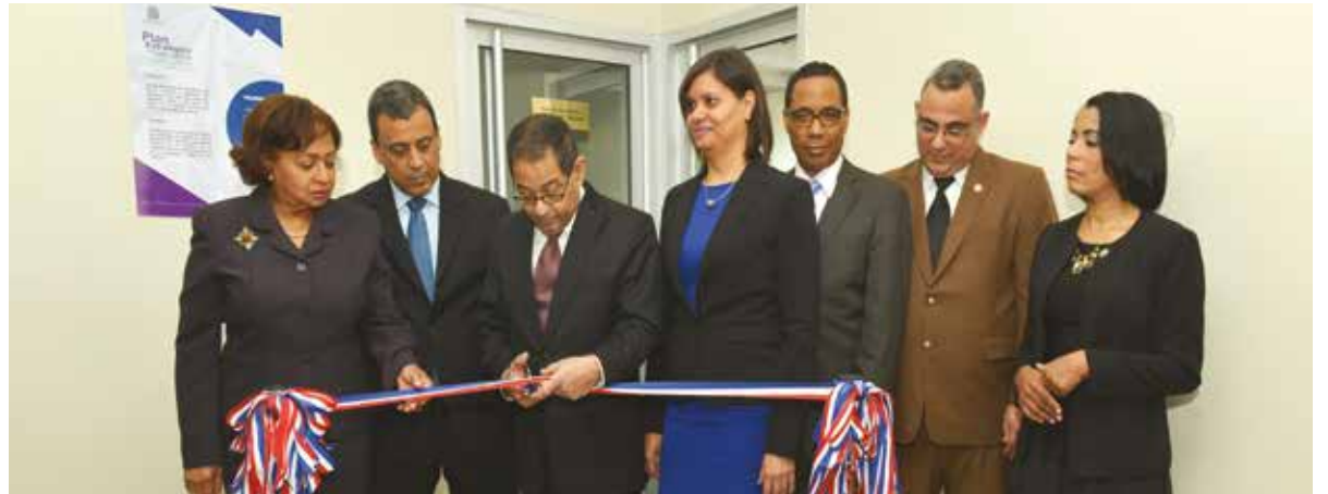
El nuevo tribunal está ubicado en el Palacio de Justicia del sector Las Caobas en Herrera.

La creación de un Tercer Tribunal Colegiado de la Cámara Penal del Juzgado de Primera Instancia con sede en el Palacio de Justicia de Las Caobas vendrá a sumarse a la Oficina Judicial de Servicios de Atención Permanente y al Juzgado de la Instrucción que