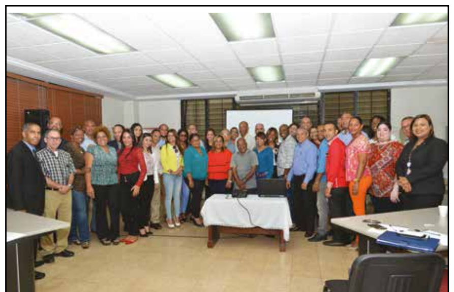
Participaron periodistas de Santiago, La Vega, Moca y Bonao.