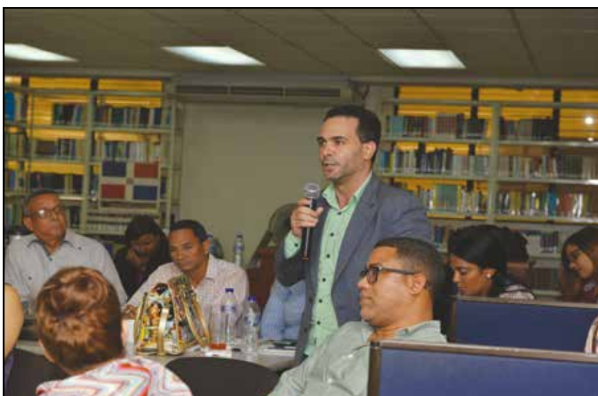
Los asistentes plantearon diversas inquietudes.