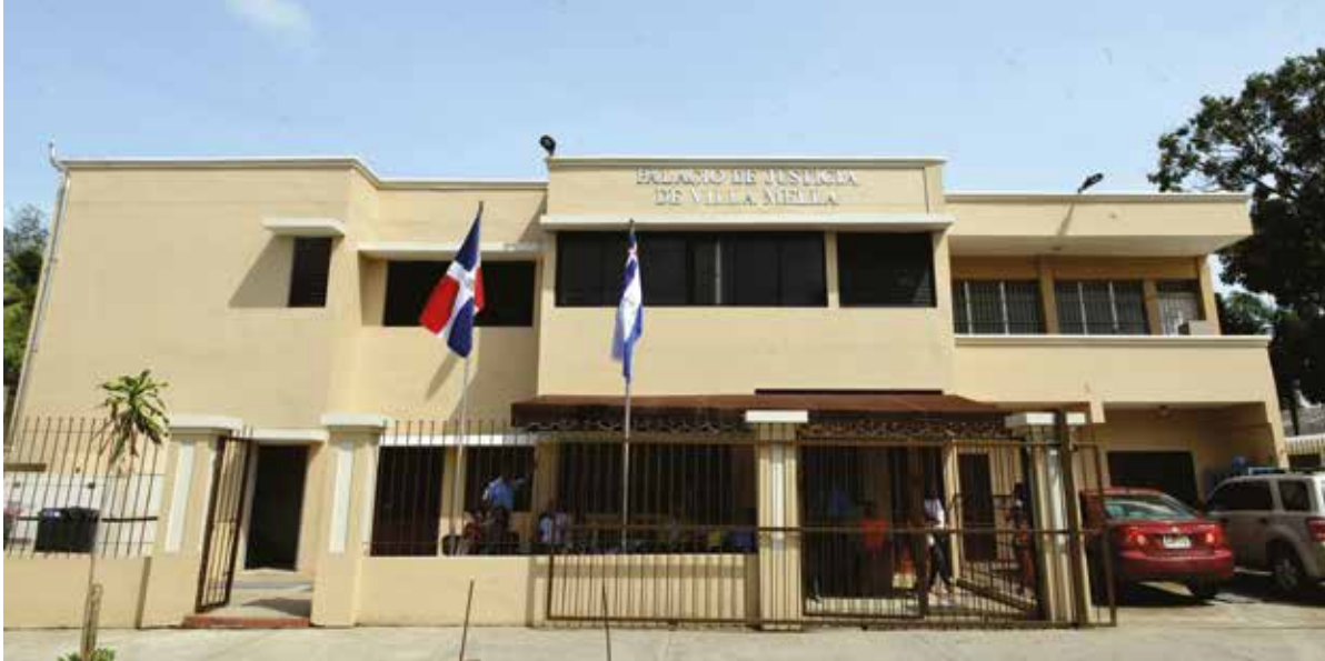
La puesta en funcionamiento de la Tercera Sala del Juzgado de Trabajo de Santo Domingo Norte, forma parte de los compromisos asumidos por el Poder Judicial durante la Cumbre Judicial Nacional celebrada en el 2016.