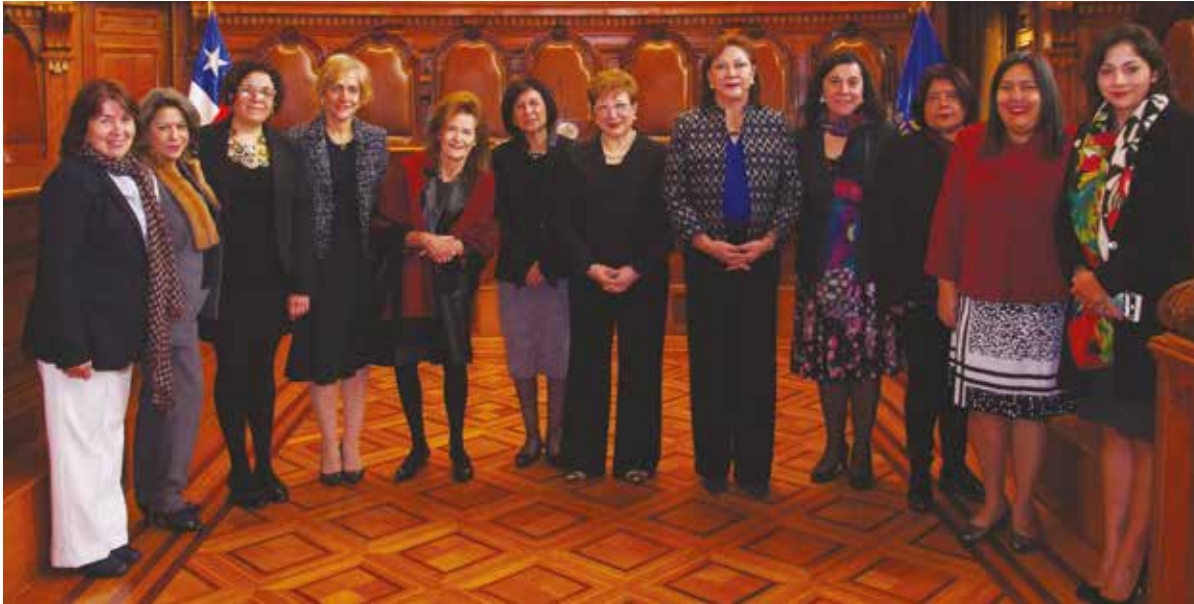
A la cumbre asistieron representantes de Centroamérica y el Caribe.

La III reunión ordinaria de la Comisión Permanente de Género y Acceso a la Justicia de la Cumbre Judicial Iberoamericana, tuvo lugar en la ciudad de Santiago de Chile, los días 23 al 25 de agosto de 2017. A esta comisión pertenecen siete países, de los cuales República Dominicana es uno de ellos.