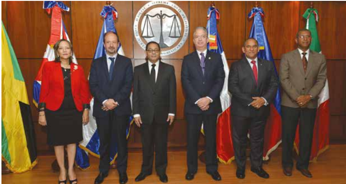
El taller se desarrolló en el Auditorio de la Suprema Corte de Justicia.