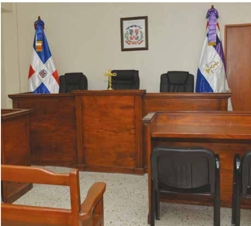
Tercer Tribunal Colegiado de la Cámara Penal del Juzgado de Primera Instancia del Distrito Judicial de Santo Domingo Oeste.