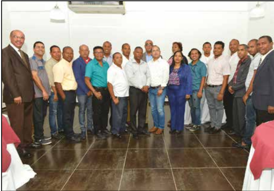
Al encuentro de capacitación se dieron cita un selecto grupo de periodistas y comunicadores de Azua, Baní, San Juan y Barahona.