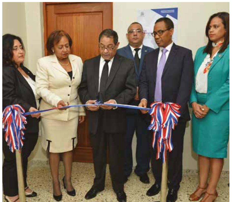
El magistrado Mariano Germán realiza el corte de cinta que deja inaugurado la Tercera Sala del Juzgado de Trabajo del Distrito Judicial de Santo Domingo Norte.