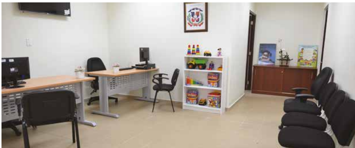
Las instalaciones del nuevo centro de entrevistas para personas en condición de vulnerabilidad, ubicado en la calle José Gabriel García en Ciudad Nueva.

El presidente de la Suprema Corte de Justicia (SCJ) y del Consejo del Poder Judicial (CPJ), doctor Mariano Germán Mejía, inauguró un nuevo Centro de Entrevistas para personas en condición de vulnerabilidad, testigos o víctimas de delitos.