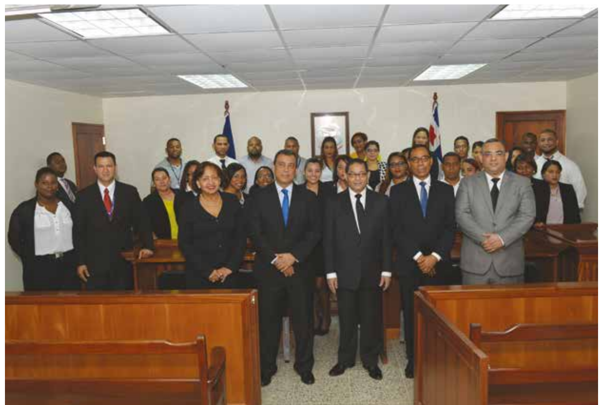
Los jueces que laborarán en este nuevo espacio entienden que el traslado de la Presidencia, así como de la Primera y Segunda Sala de la Cámara Penal de la Corte, propiciará un mejor desenvolvimiento en ese Departamento Judicial de Santo Domingo.