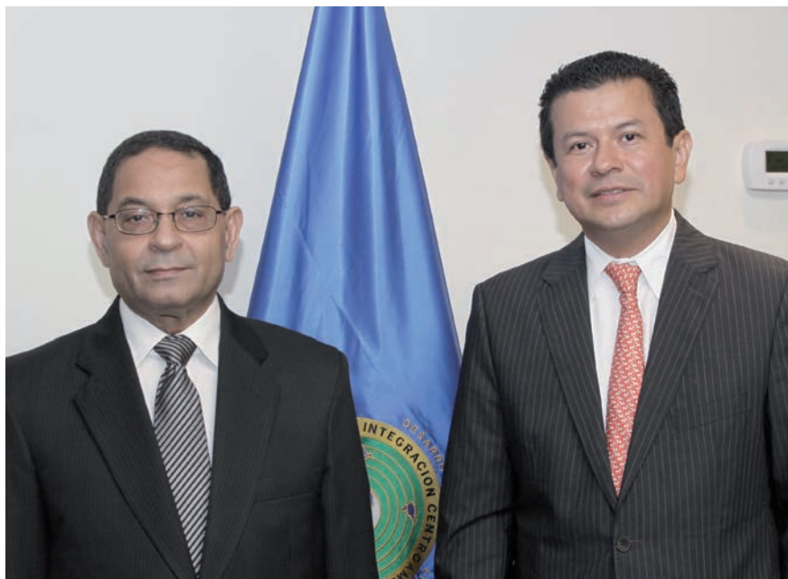
El magistrado Germán Mejía junto al Secretario General del Sistema de la Integración Centroamericana (SICA).

El Poder Judicial durante el año 2013 continuó su política de ampliar y fortalecer sus relaciones internacionales, reconociendo que vivimos en un mundo donde la cooperación internacional es fundamental para mejorar la administración de justicia y combatir el crimen organizado.