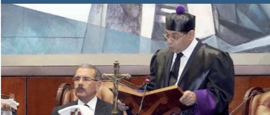
El Día del Poder Judicial se celebra con una misa de acción de gracias, una ofrenda floral y la Audiencia Solemne.

Durante 15 años, y por mandato de Ley, la Judicatura dominicana celebra el 7 de enero "El Día del Poder Judicial", ocasión en que la justicia realiza una serie de actividades propias para la ocasión.