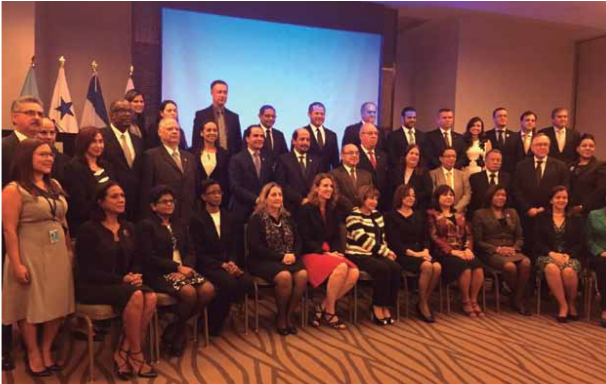
El evento se desarrolló en Panamá.