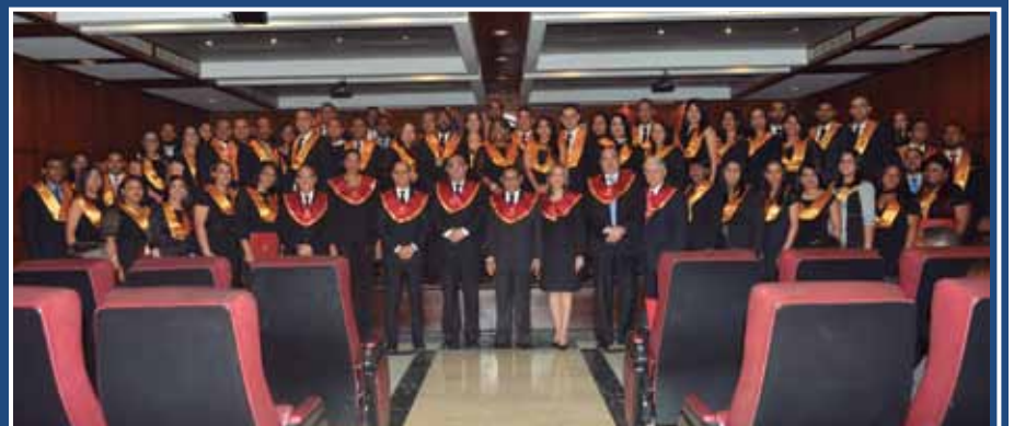
Los nuevos defensores públicos junto a miembros del Consejo Directivo de la ENJ.