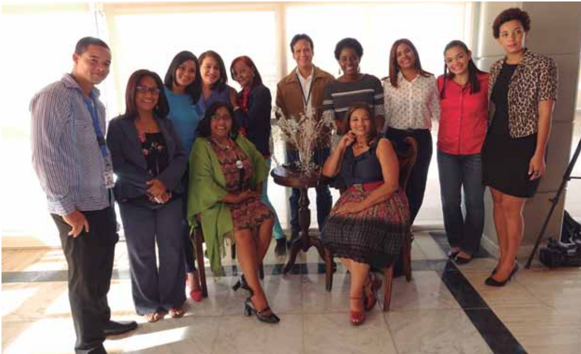
Los miembros de la prensa departen entre ellos durante durante la celebración del encuentro navideño.