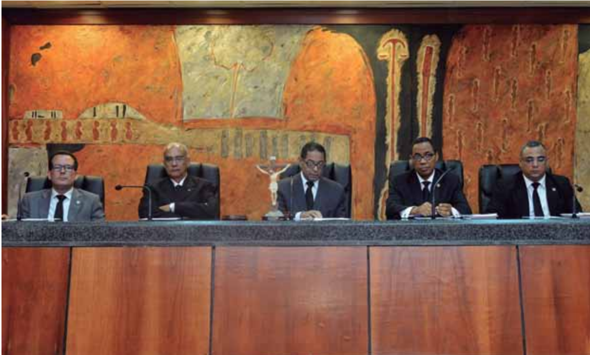
La medida busca establecer pautas para un mejor control de la calidad de los servicios.

Como parte de los compromisos asumidos el 7 de octubre en la Cumbre Judicial Nacional, el Consejo del Poder Judicial (CPJ) aprobó el Manual de Procedimientos de la Inspectoría General de ese organismo, con el objetivo de reglamentar la inspección de los órganos jurisdiccionales y de los servicios de administración de justicia.