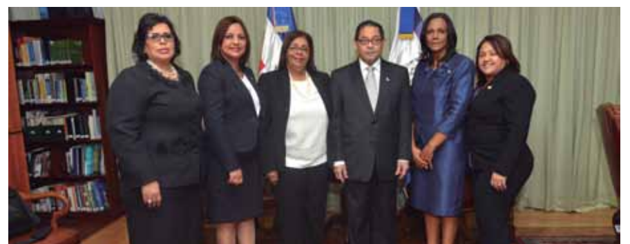
El magistrado Mariano Germán junto a la Comisión Permanente de Asuntos de Equidad de Género de la Cámara de Diputados.

La diputada destacó que el Poder Judicial forma parte de las instituciones que trabajan en aspectos como la promoción de la cultura de paz, resolución alternativa de los conflictos, igualdad y equidad.