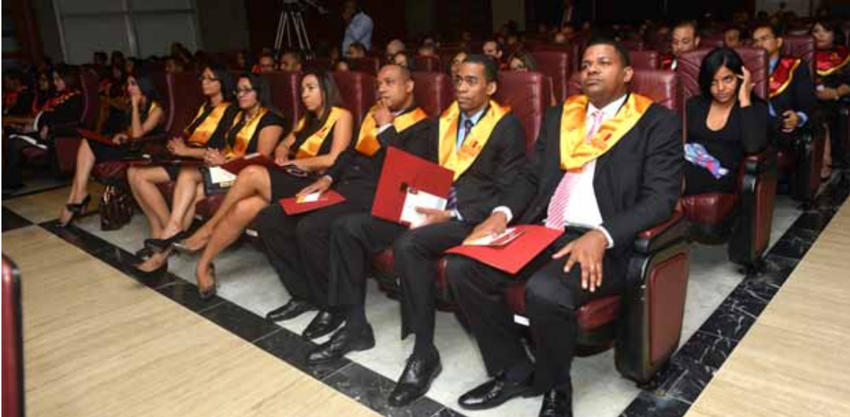
En la actividad fueron entregados 230 títulos académicos.