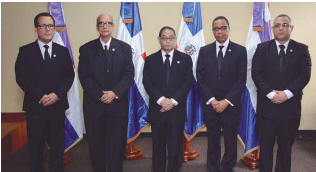
Los miembros del Consejo del Poder Judicial.

El Consejo del Poder Judicial (CPJ) dispuso la apertura de la Primera Sala del Juzgado de Trabajo del Distrito Judicial de Santo Domingo, con el propósito de lograr mayores niveles de eficiencia en el sistema de administración de justicia.