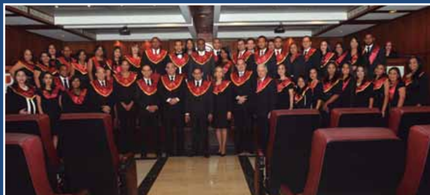
Del programa egresaron 78 nuevos jueces de Paz.