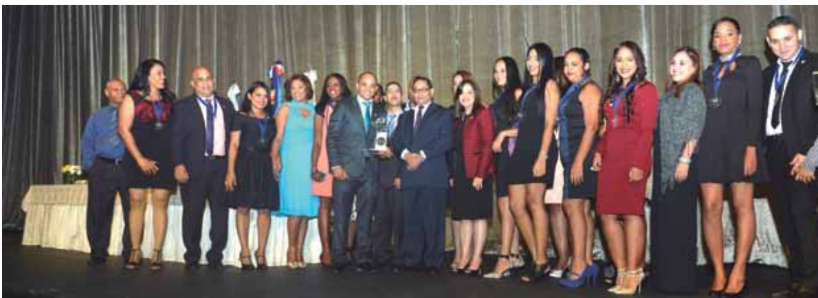
Hubo galardones en todos los renglones