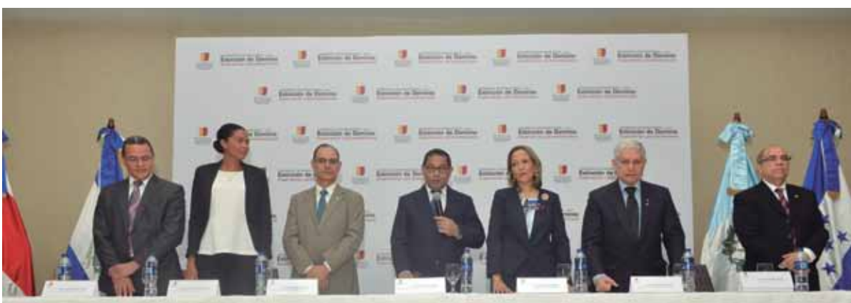
El magistrado Mariano Germán pronunció las palabras de apertura del evento.

El presidente de la Suprema Corte de Justicia y del Consejo del Poder Judicial, Mariano Germán Mejía encabezó el Primer Congreso sobre Extinción de Dominio: Experiencia Latinoamericana, en donde proclamó estar convencido de que el patrimonio de una persona debe construirse sobre la base de la legalidad y la legitimidad.