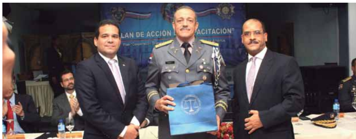
Desde la derecha, el magistrado Justiniano Montero, el mayor general Nelson Peguero Paredes y el inspector general del Consejo del Poder Judicial, Leonidas Radhamés Peña.

El programa de capacitación forma parte de un acuerdo institucional con la Policía Nacional dominicana, Policía de Colombia y la Embajada de los Estados Unidos.