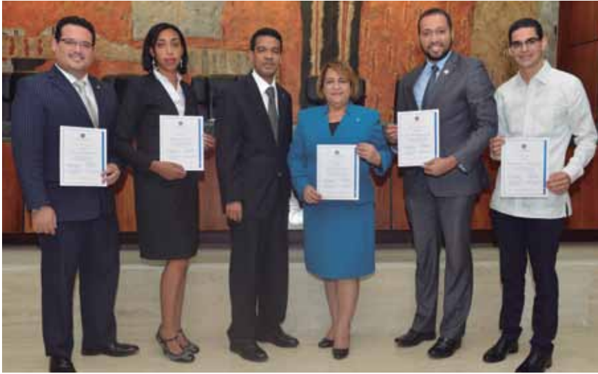
Los ganadores recibieron su certificado de concurso de ética judicial

El Poder Judicial celebró el acto de premiación a nivel nacional del X Concurso Internacional de Trabajo Monográfico en torno al Código Iberoamericano de Ética Judicial en su Octava edición, bajo el tema "Transparencia".