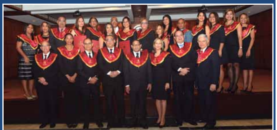
Un importante grupo de magistrados se recibió en Maestría de Derecho Judicial y otras especialidades.