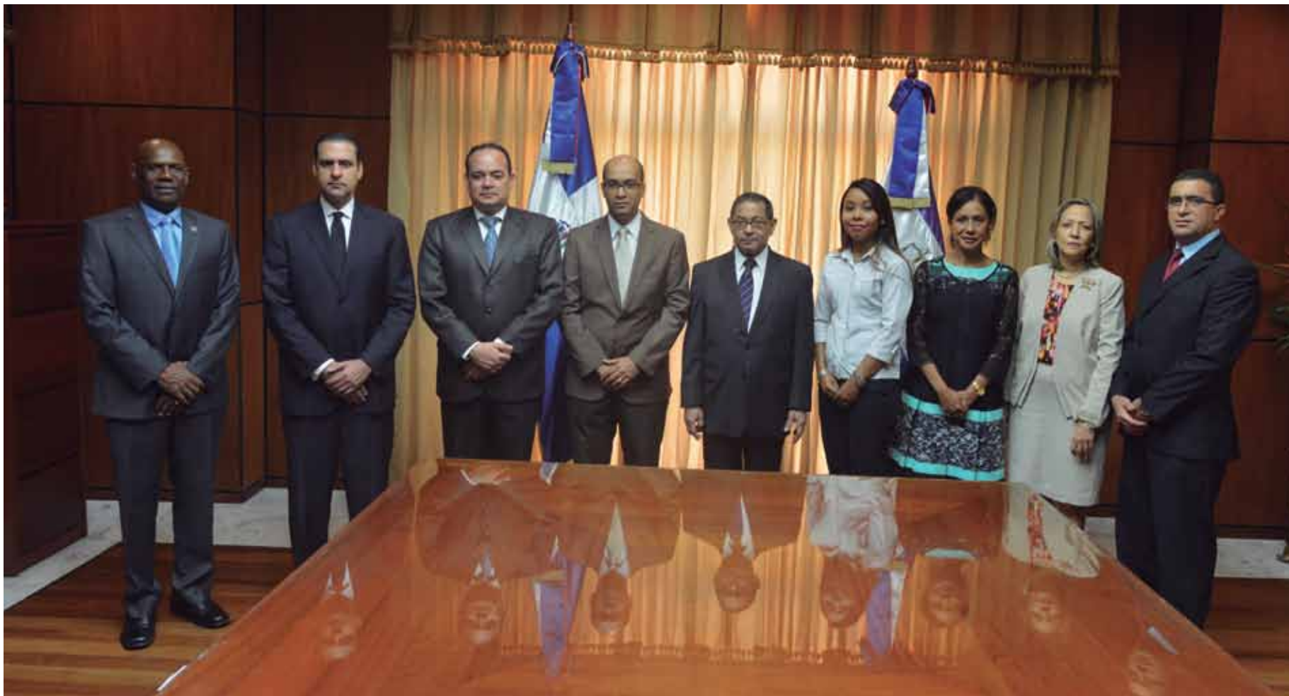
Integrantes de la Comisión de Seguimiento a los acuerdos de la Cumbre Judicial Nacional.