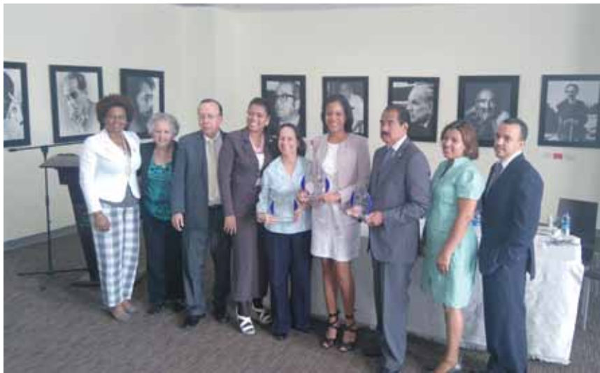
El Poder Judicial fue reconocido como Modelo de Depósito Legal de Publicaciones.

La Biblioteca Nacional Pedro Henríquez Ureña otorgó un reconocimiento al Poder Judicial en el reglón institucional, por acrecentar sus fondos bibliográficos, preservar, difundir y conservar la herencia histórica para las nuevas generaciones.