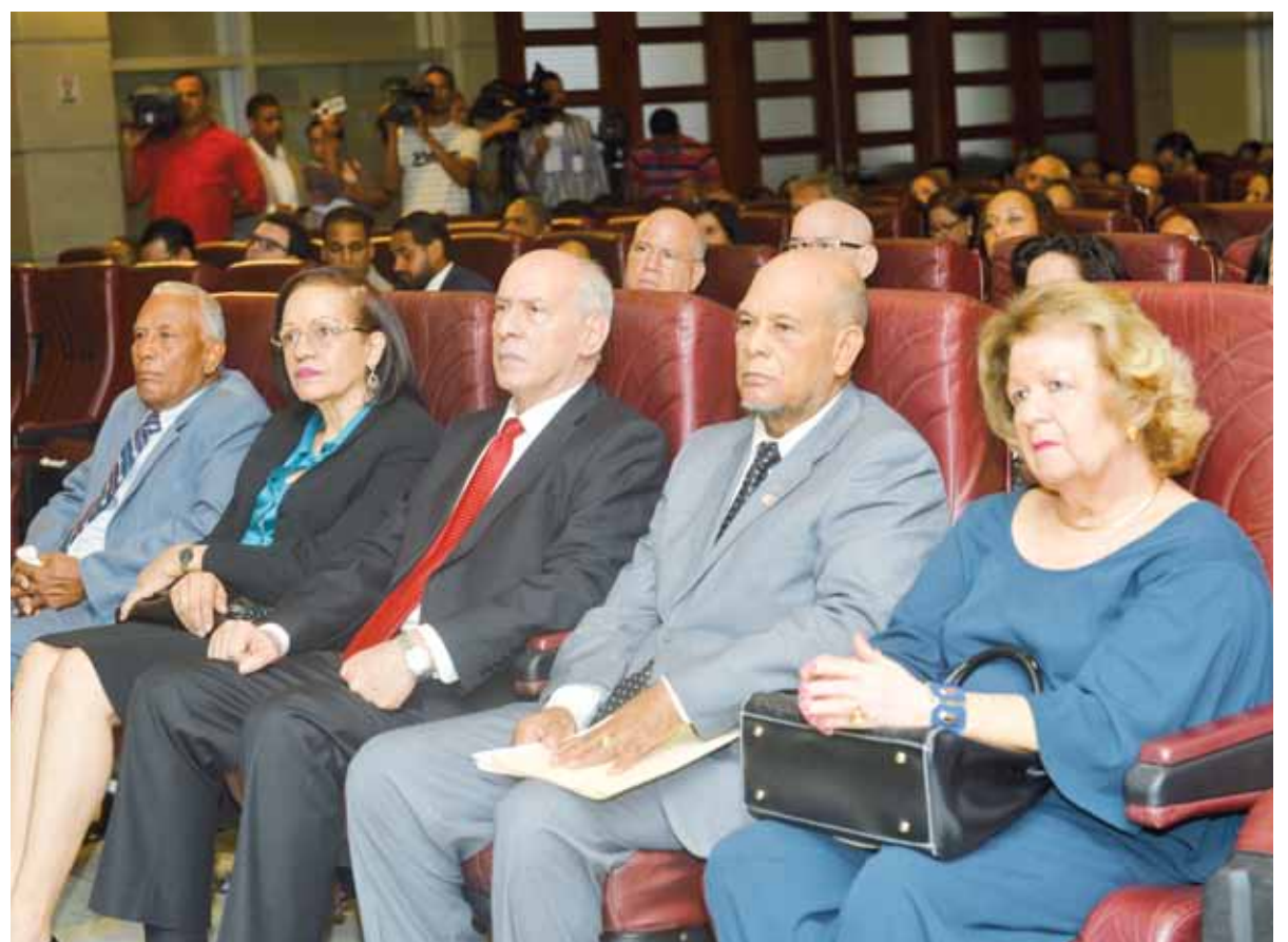
Los magistrados fueron reconocidos por haber desempeñado una labor ética y exhibir una conducta ejemplar.

Manifestó que el mejor legado que dejan a sus compañeros es su esfuerzo y trabajo honrado.