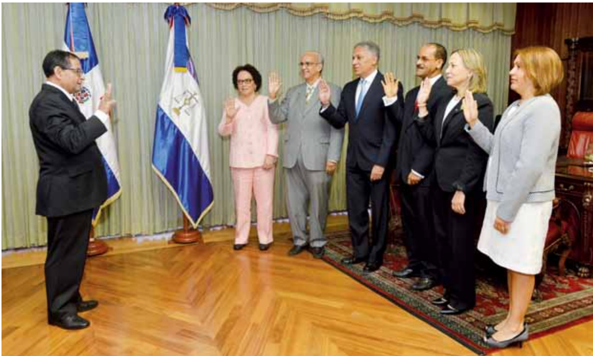
Jueces y funcionarios integrantes del Comité de Comportamiento Ético.