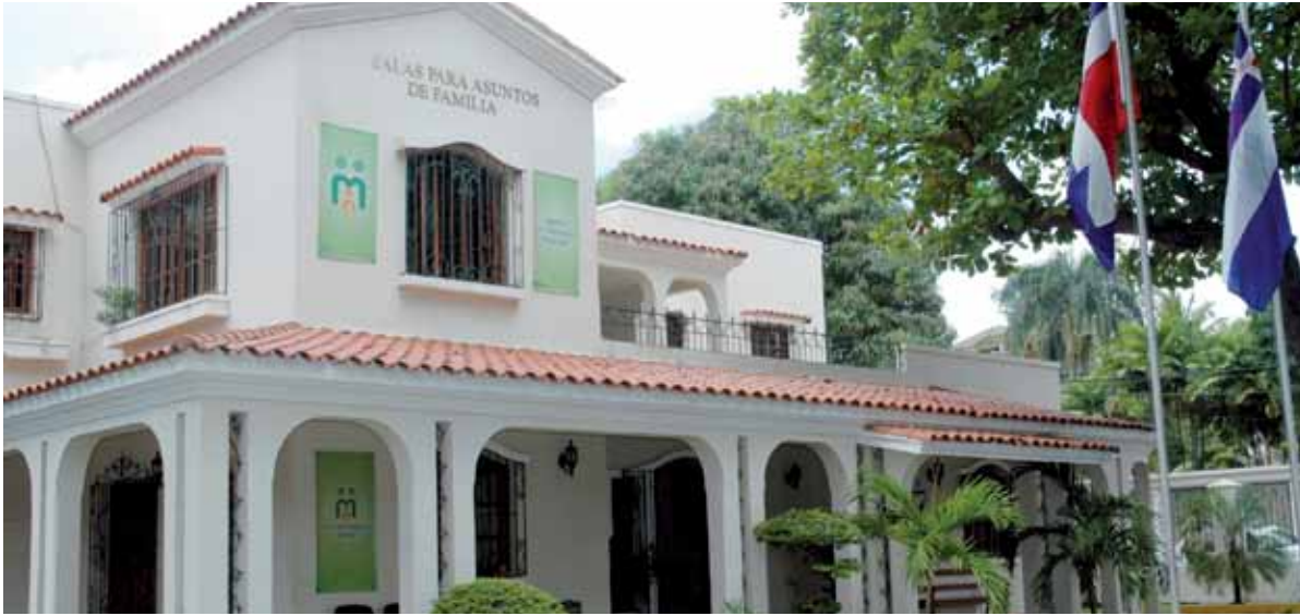
El Centro de Mediación Familiar cumplió 10 años de funcionamiento.

El Poder Judicial, a través del Centro de Mediación Familiar (CEMEFA), ha realizado durante los 10 años de su creación, unas 16,671 mediaciones las cuales han impactado en 271,245 personas involucradas en los casos y 43,513 niños, niñas y adolescentes se han favorecido de estas acciones.