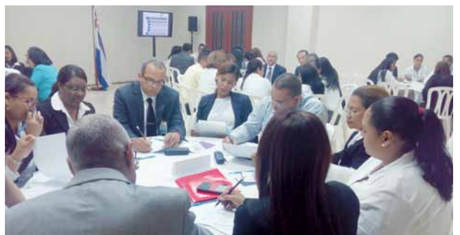
Distintas actividades han sido desarrolladas en el marco de la Cumbre Judicial Nacional.