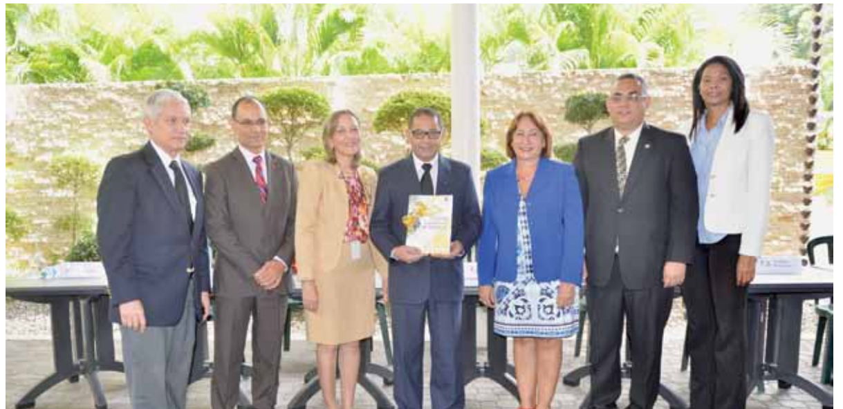
El acto de presentación de la carta compromiso fue realizado en la sede de la Escuela Nacional de la Judicatura.

Asimismo, por cumplir la norma de Calidad ISO-2008, obtuvo certificación en el 2014, de medallas de oro y bronce por ajustarse al Marco Común de Evaluación (CAF), modelo organizativo de excelencia.