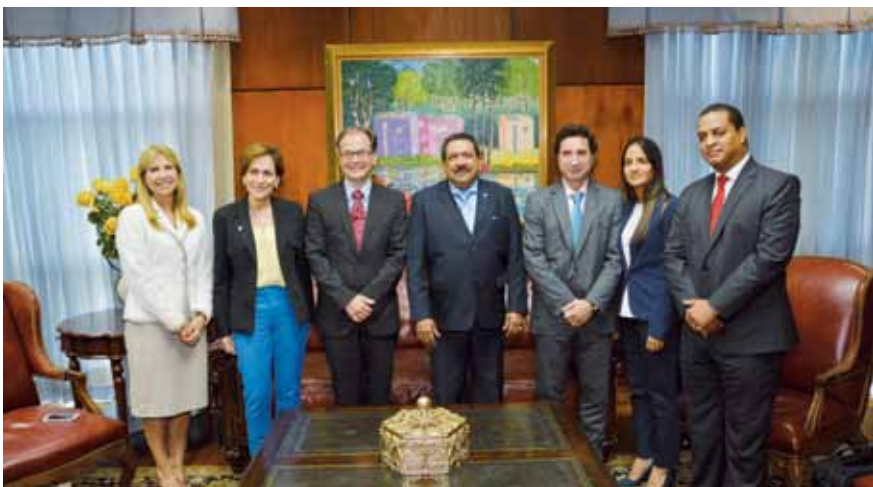
Miembros de la Delegación de La Haya y jueces de la Suprema Corte de Justicia durante el encuentro en el que también participaron funcionarios del CONANI.

La Conferencia Internacional de la Haya de Derecho Privado gestiona que República Dominicana pase a formar parte de ese organismo y se adhiera al Convenio del 23 de noviembre de 2007, sobre Cobro Internacional de Alimentos para los Niños y otros Miembros de la Familia.