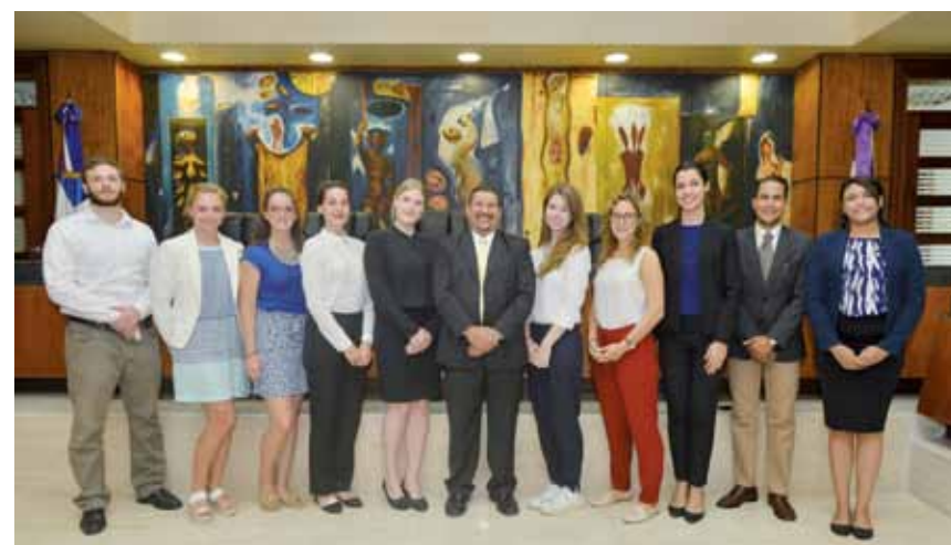
La delegación junto al magistrado Hirohito Reyes, quien dio explicación sobre la administración de justicia penal en el país.

El Programa Intercontinental de Pasantías fue establecido en el año 2014, a través de un acuerdo bilateral entre la Asociación Europea de Estudiantes de Derecho (ELSA) y la Asociación Dominicana de Profesionales y Estudiantes de Derecho (ADED).