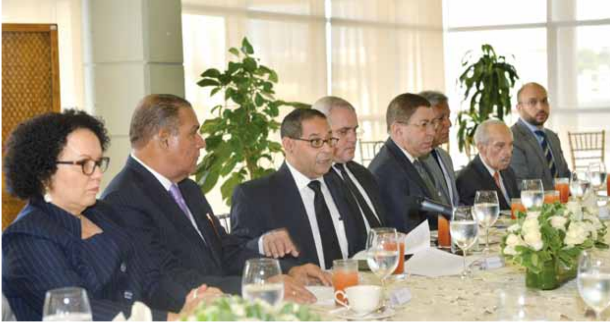
El magistrado Mariano Germán Mejía explica sobre la situación financiera del Poder Judicial.

El presidente de la Suprema Corte de Justicia y del Consejo del Poder Judicial, magistrado Mariano Germán Mejía sostuvo un encuentro con los directores de medios de comunicación, con los cuales socializó la situación del Poder Judicial, y los avances en el proceso de organización de la Cumbre Judicial Nacional.