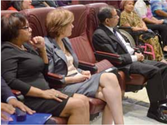
Con la medida el Consejo del Poder Judicial busca evitar la exclusión de las personas que tienen algún tipo de discapacidad.

El presidente de la Suprema Corte de Justicia (SCJ) y del Consejo del Poder Judicial (CPJ), doctor Mariano Germán Mejía, encabezó la presentación de un conjunto de normas que regirán la política de igualdad para las personas con discapacidad en poder del Estado.