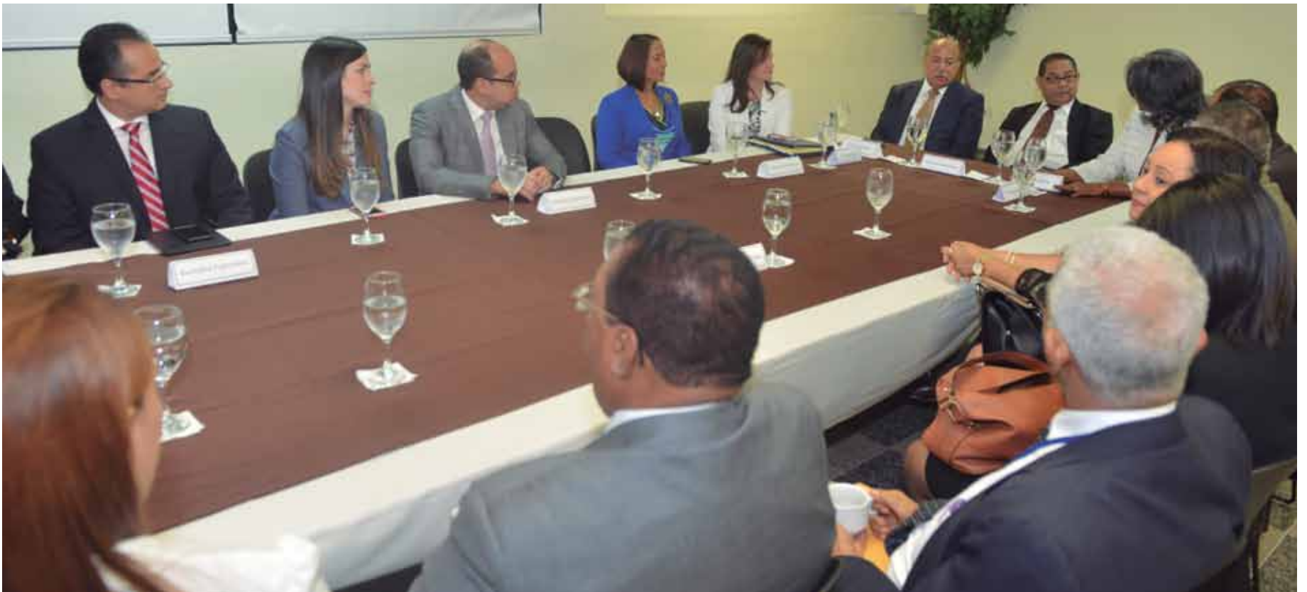
El Sistema de Recepción y Entrega del Registro de Títulos inició como piloto en el Distrito Nacional.

Como parte de los compromisos firmados en la Cumbre Judicial Nacional, el presidente de la Suprema Corte de Justicia (SCJ) y del Consejo del Poder Judicial (CPJ), doctor Mariano Germán Mejía, inauguró el Sistema de Recepción y Entrega del Registro de Títulos del Distrito Nacional.