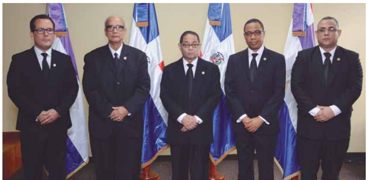
Miembros del Consejo del Poder Judicial.