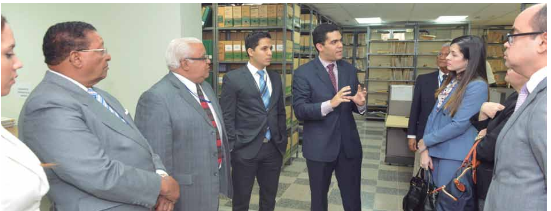
Un técnico da explicaciones del sistema de Recepción y Entrega del Registro de Títulos que implementa la JI.

En esta primera presentación estuvieron presentes diferentes instituciones y gremios en el ámbito inmobiliario, a saber: Asociación de Industrias de República Dominicana (AIRD), Fundación Institucionalidad y Justicia (FINJUS), Asociación de Hacendados y Agricultores, Asociación de Bancos Comerciales, Liga Dominicana de Asociación de Ahorros y Préstamos, Cámara Americana de Comercio de República Dominicana, Asociación Dominicana de Constructores y Promotores de Viviendas (Acoprovi), entre otros.