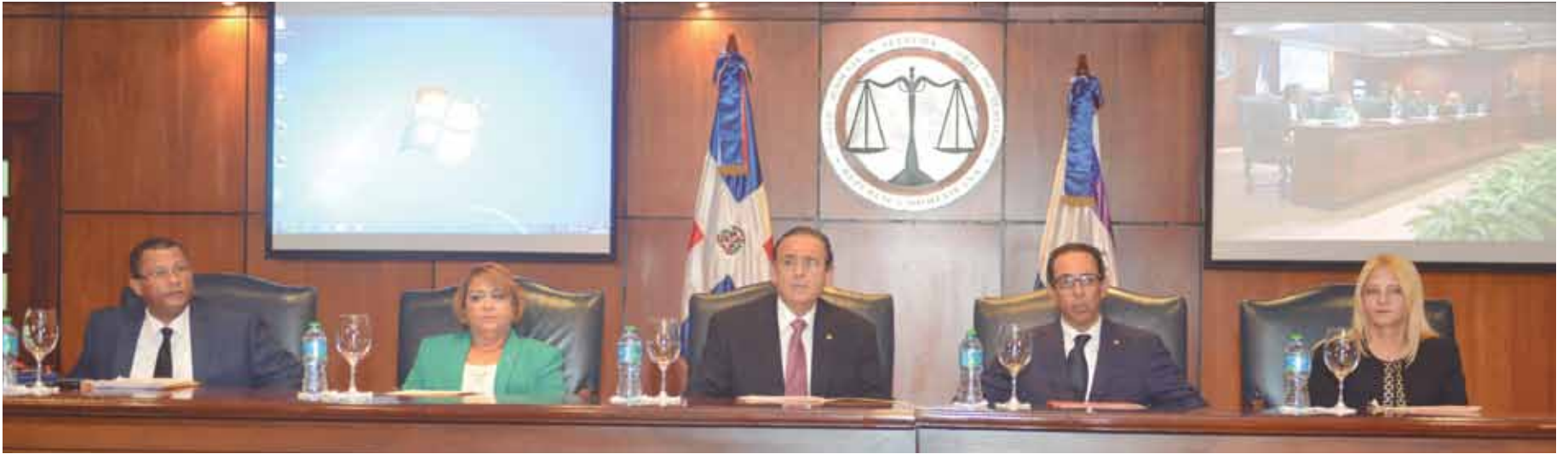
El taller "Sugerencia para el mejoramiento de la Jurisdicción Inmobiliaria dominicana" fue organizado por la Unidad Académica de la Suprema Corte de Justicia.

La Unidad Académica de la Suprema Corte de Justicia (UASCJ) celebró el II Panel Nacional de Derecho Inmobiliario, bajo el tema "Sugerencia para el Mejoramiento de la Jurisdicción Inmobiliaria Dominicana", en el que disertaron jueces, juezas y otros expertos en la materia.