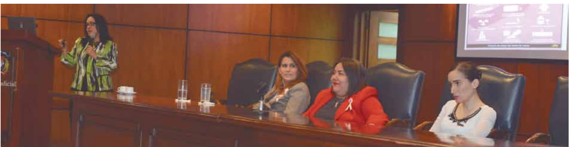
El objetivo de esa iniciativa es crear conciencia sobre la importancia de la detección temprana del cáncer de mama.

La Dirección de Familia, Niñez, Adolescencia y Género del Poder Judicial (DIFNAG) celebró la charla “Detección y Prevención Oportuna del Cáncer de Mama”, dirigida a servidoras y servidores del Poder judicial.