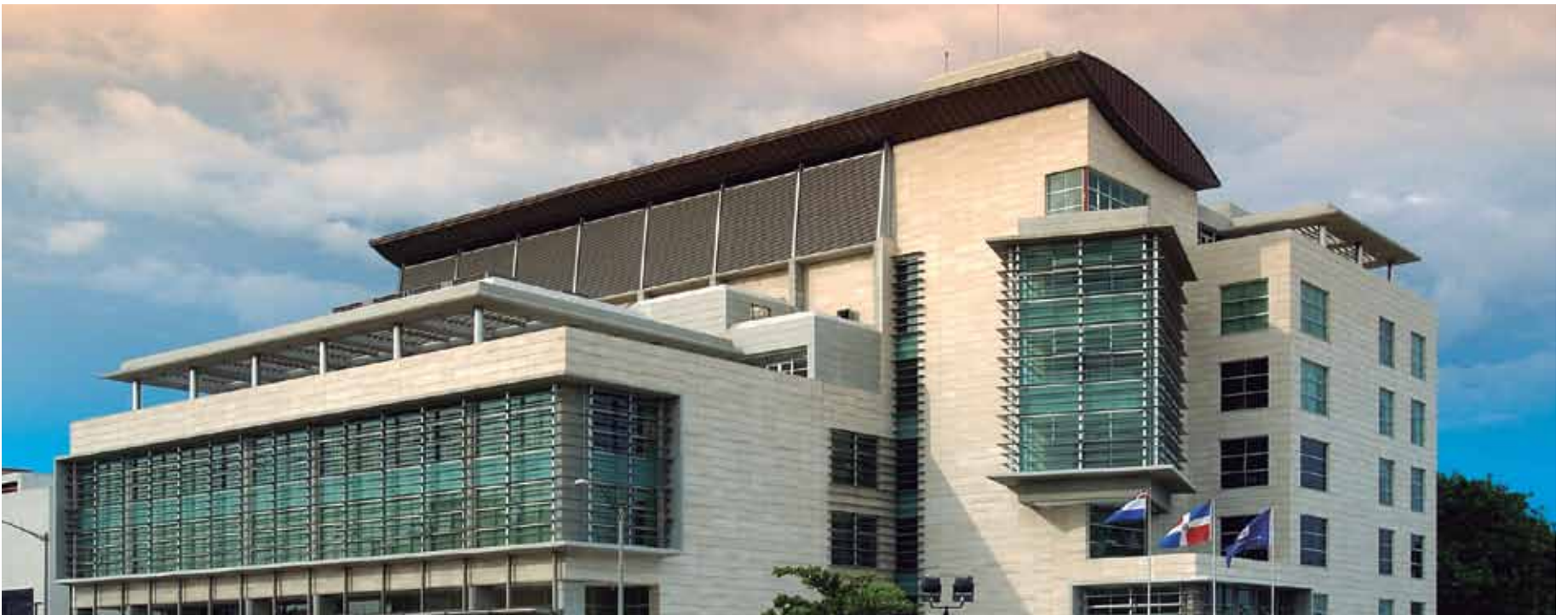
Los 21 jueces ascendidos pertenecen a distintas jurisdicciones del país.

El Pleno de la Suprema Corte de Justicia aprobó el ascenso de 21 jueces y juezas de distintas jurisdicciones del país, tomando en cuenta su desempeño en el cargo, la trayectoria en el Poder Judicial y el tiempo de servicio.