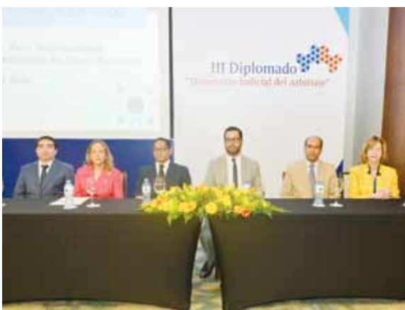
El diplomado tiene como finalidad especializar a los profesionales del ámbito judicial en temas de resolución de conflictos.