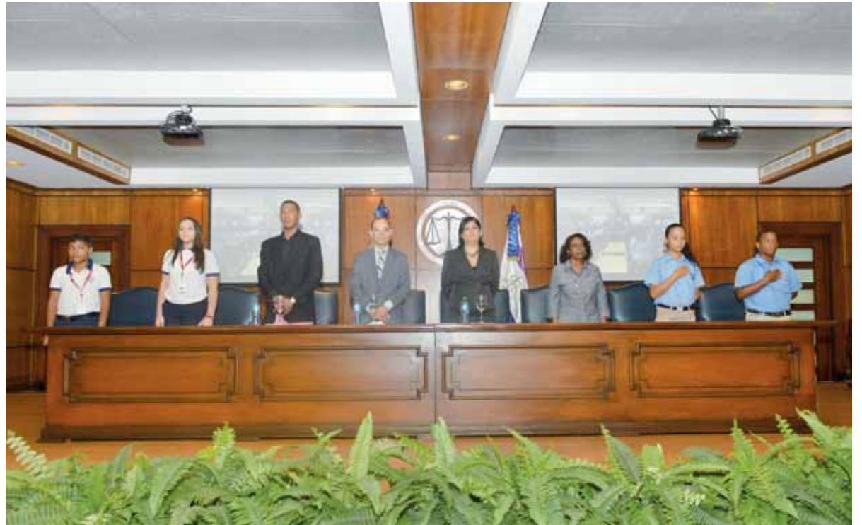
Responsables de la capacitación a los estudiantes y del programa de mediación escolar.

“Con este mensaje lo que quiero también es que ustedes sean solidarios, recibir este certificado no les hace a ustedes buenas personas, solo serán buenas personas si ustedes quieren serlo, les animo a que hagan de su vida un modelo”, aseguró.