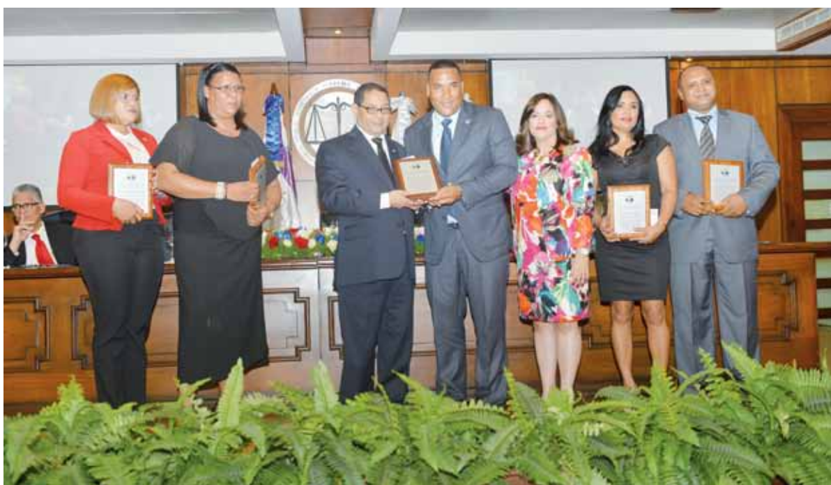
La celebración del defensor del año 2015, se realizó en el marco del XII aniversario de la Oficina Nacional de Defensa Pública.