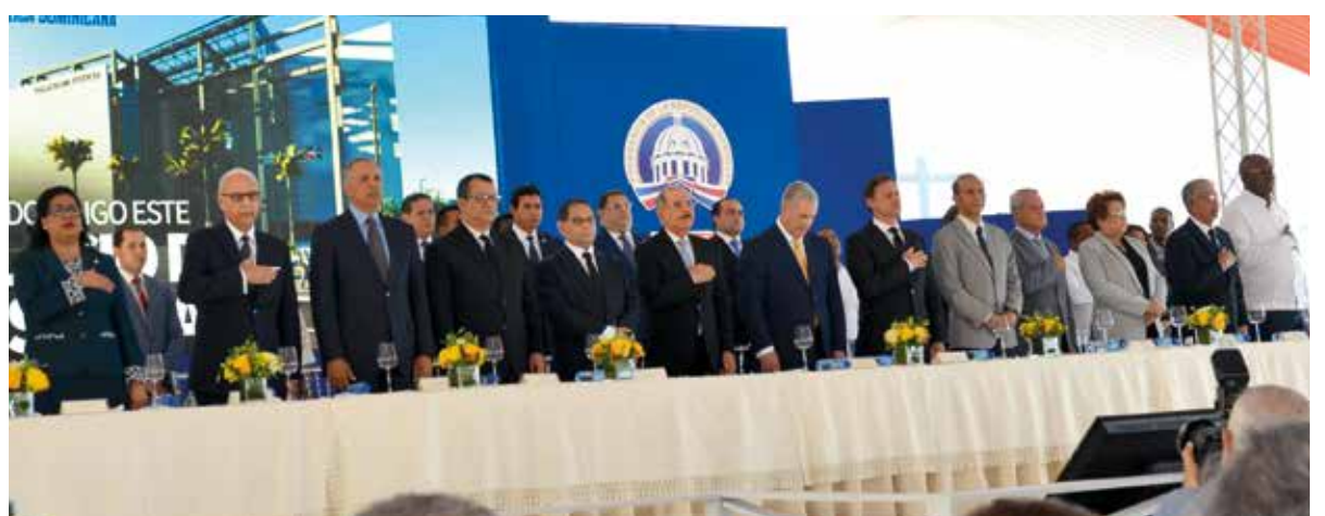
La nueva edificación será construida por el Ministerio de Obras Públicas y Comunicaciones.

Al finalizar la ceremonia, el presidente Medina, el magistrado Mariano Germán Mejía, el ministro de obras públicas, Gonzalo Castillo, el procurador general de la República y los demás integrantes de la mesa de honor dejaron formalmente iniciada la construcción dando el primer palazo.