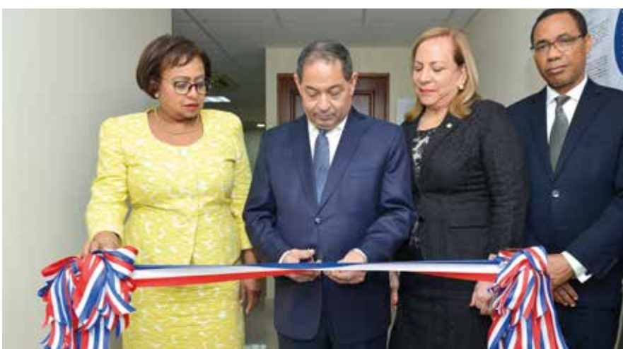
El Magistrado Mariano Germán Mejía realiza el corte de la cinta.

E l presidente del Poder Judicial, doctor Mariano Germán Mejía, encabezó la inauguración del local que alojará la Corte de Apelación de Niños, Niñas y Adolescentes del Departamento Judicial de Santo Domingo y los tribunales de Niños, Niñas y Adolescentes del municipio de Santo Domingo Este.