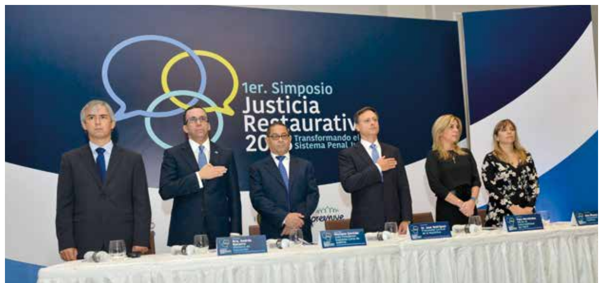
La actividad fue encabezada por el magistrado Mariano Germán Mejía.