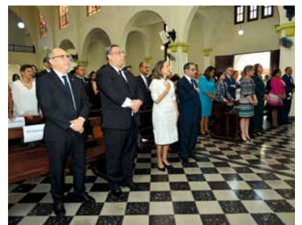
Principales miembros del Consejo Directivo de la ENJ.