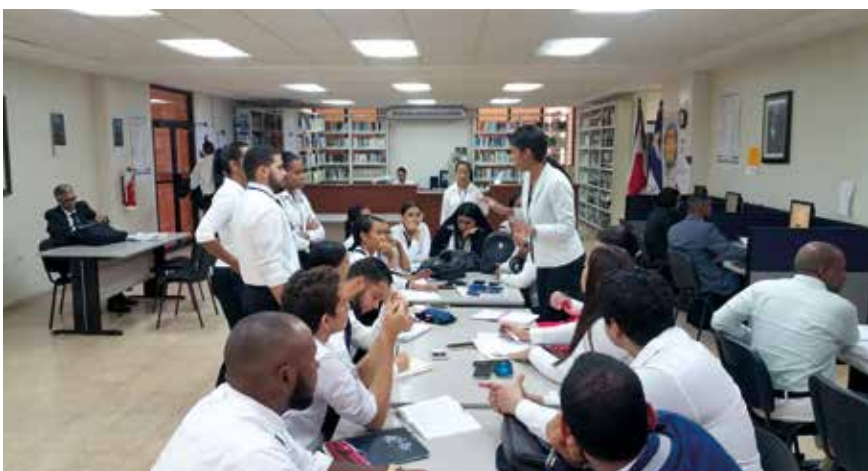
Los estudiantes estuvieron muy activos en el encuentro.