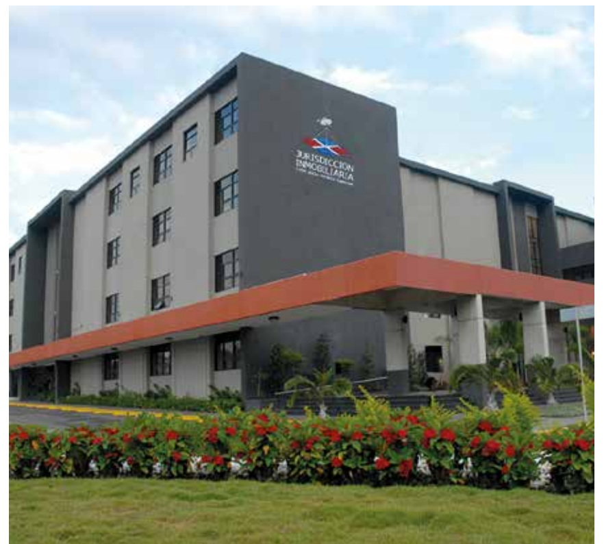
Edificio que aloja la Jurisdicción Inmobiliaria en el Distrito Nacional.

Para solicitar el acceso al portal, los usuarios deben completar un formulario en línea que está disponible en la página web de la Jurisdicción Inmobiliaria: www.ji.gob.do , identificado con el nombre Oficina Virtual de Mensuras.