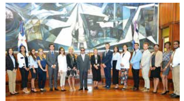
El magistrado Germán Mejía junto al grupo de estudiantes.

Los estudiantes, quienes proceden de Francia, Eslovaquia, Noruega, España, Italia, Finlandia y República Dominicana, explicaron que su visita es en interés de conocer la estructura y funcionamiento del edificio de la Suprema Corte de Justicia.