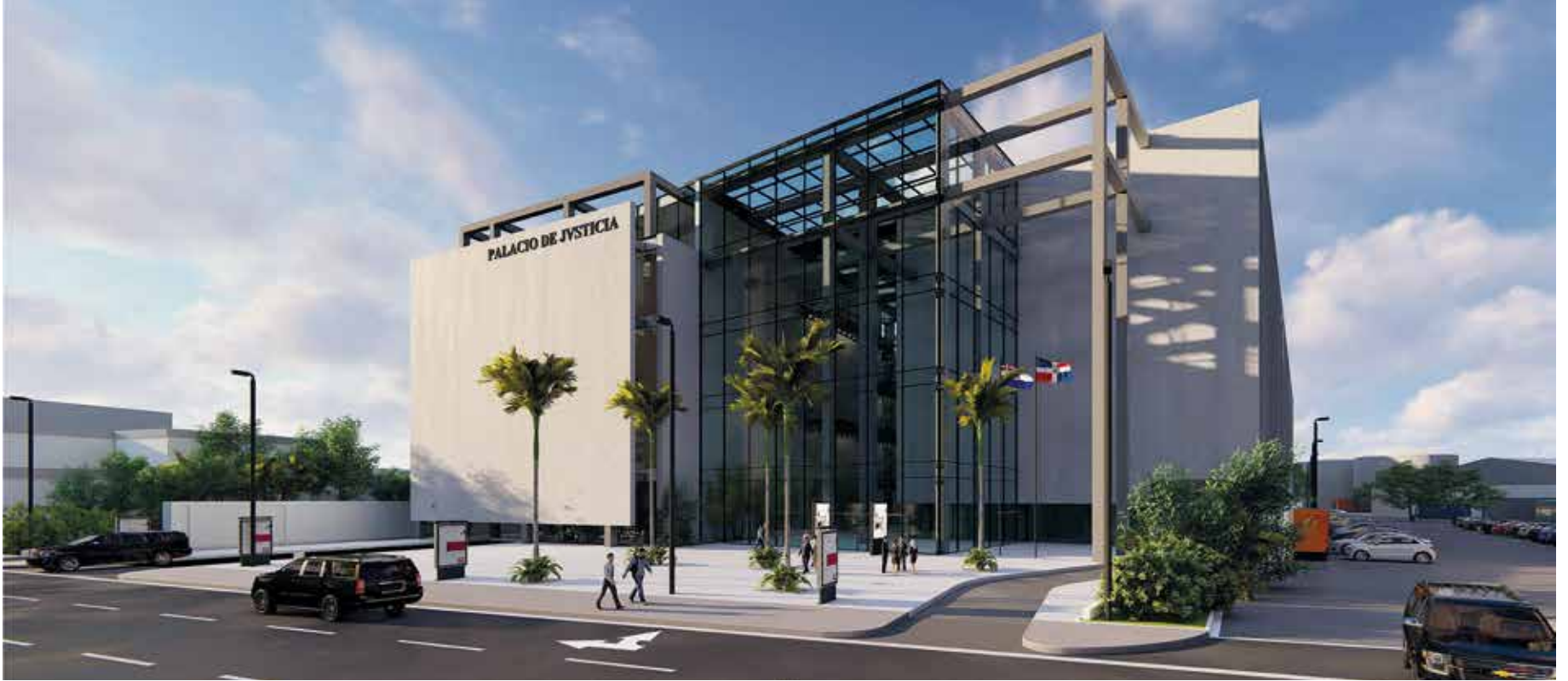
El Palacio de Justicia de la Provincia Santo Domingo estará construido con una arquitectura contemporánea y enfoque bioclimático.

El presidente de la República, Danilo Medina y el presidente del Poder Judicial, doctor Mariano Germán Mejía, dejaron formalmente iniciada la construcción del Palacio de Justicia de Santo Domingo Este, el cual estará dotado de cinco niveles e igual número de bloques que alojarán las oficinas de la mayoría de tribunales de ese Departamento Judicial y del Ministerio Público.