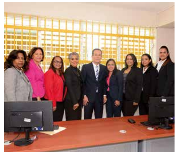
Centro Ad-hoc de Najayo-Hombres y Najayo-Mujeres, en San Cristóbal.

A los diferentes actos, que se produjeron de manera simultánea, asistieron jueces penales, de la Instrucción, de la Ejecución de la Pena, funcionarios judiciales, representantes del Ministerio Público y otros invitados.