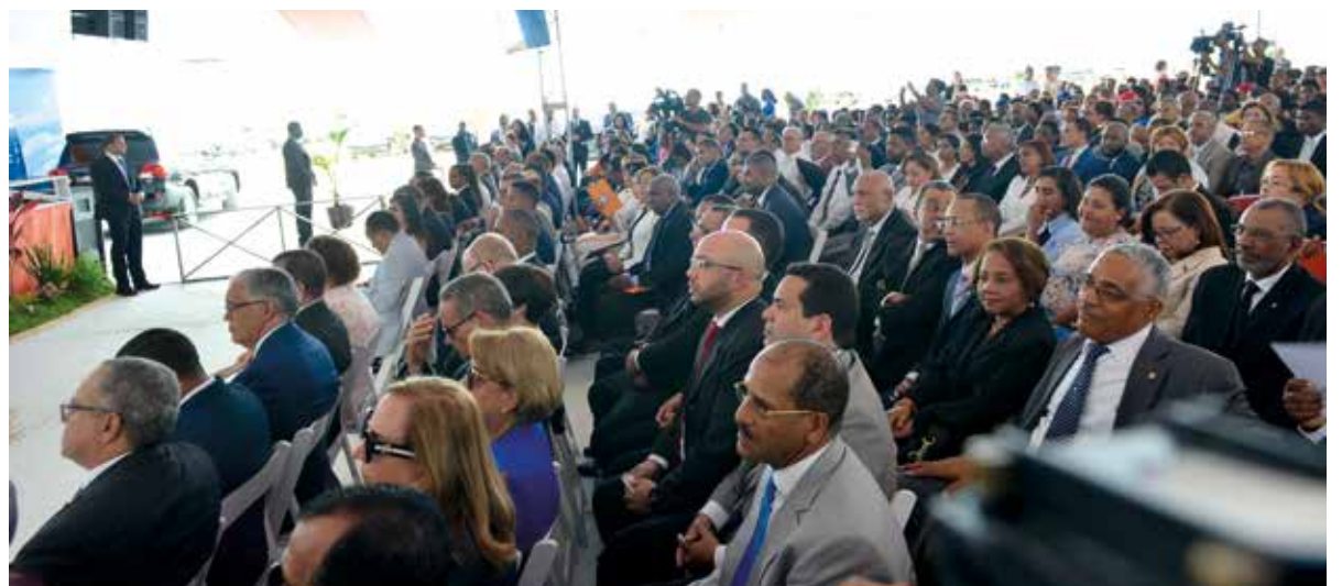
En la actividad estuvieron presentes jueces consejeros, fiscales, funcionarios judiciales e invitados especiales.

“No tenemos Jurisdicción Inmobiliaria, y a mayor razón carecemos de jurisdicciones para dirimir los conflictos institucionales”, recalzó.