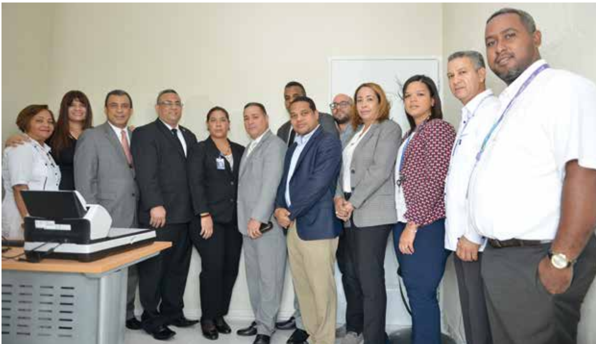
Inauguración del Centro Ad-hoc de La Victoria.

El Consejo del Poder Judicial puso en funcionamiento, simultáneamente, tres centros de notificación Ad-hoc en igual número de recintos penitenciarios del Distrito Nacional, San Cristóbal y Santiago, con competencia a nivel nacional, con el propósito agilizar las citaciones ante la dilación de los traslados de los internos hacia los tribunales.