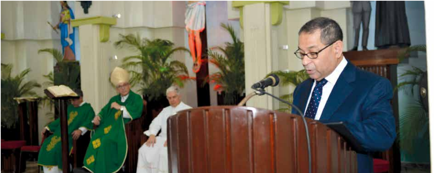
El magistrado Mariano Germán Mejía durante la misa de acción de gracias con motivo del 20 aniversario de la Escuela Nacional de la Judicatura.

La Escuela Nacional de la Judicatura (ENJ) celebró su vigésimo aniversario con una misa de acción de gracias oficiada por monseñor Víctor Masalles, durante la cual el presidente del Poder Judicial y del Consejo Directivo, magistrado Mariano Germán Mejía, destacó la consolidación y el posicionamiento de la academia.