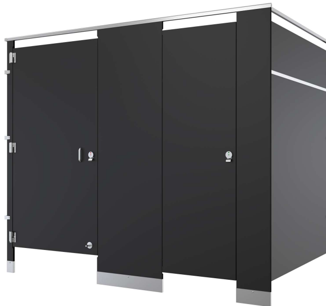
Imagen de referencia de instalación

Todos los baños deben tener los todos los paneles del mismo color.