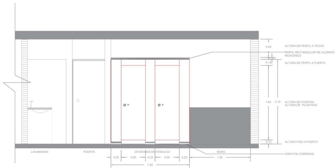
SECCIÓN A-A' PROPUESTA BAÑOS PRIVADOS 4TO -7MO NIVEL