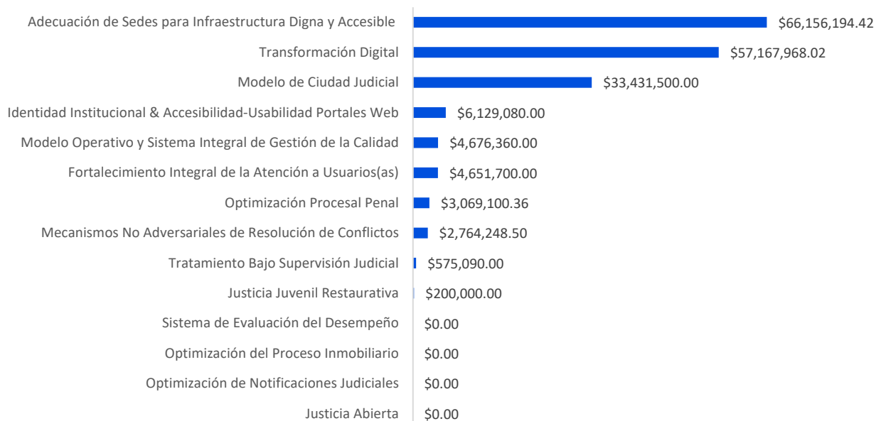
Gráfico No. 1: Distribución presupuestaria de los proyectos 2026

Nota: Aquellos proyectos que no tienen asignación presupuestaria para este año, se están ejecutando con capacidad operativa interna, sin la necesidad de recursos adicionales.