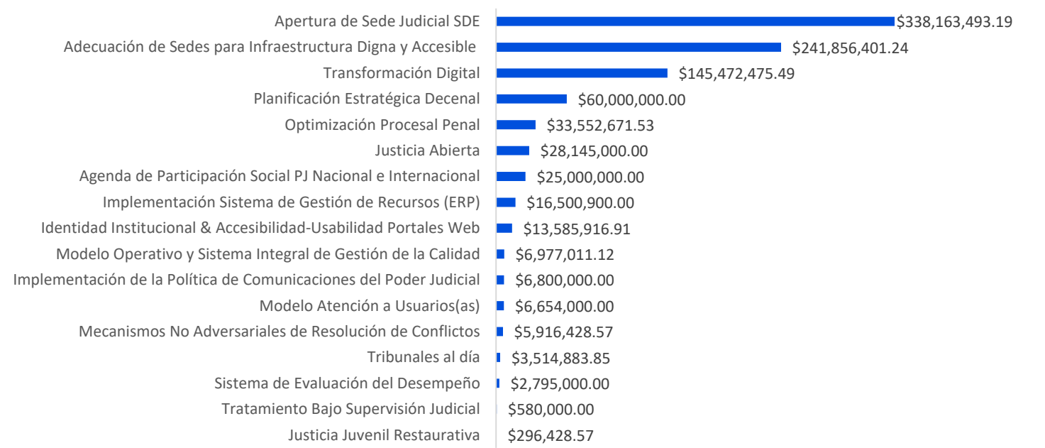
Gráfico No. 1: Distribución presupuestaria de los proyectos 2025