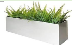
Imagen de carácter ilustrativa