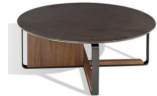
Imagen de carácter ilustrativa