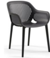
Imagen de carácter ilustrativa