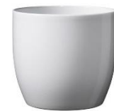
Imagen de carácter ilustrativa