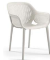
Imagen de carácter ilustrativa