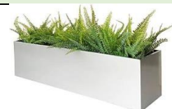
Imagen de carácter ilustrativa