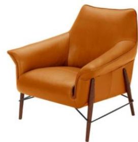
Imagen de carácter ilustrativa

NOTA: LOS MOBILIARIOS DE ESTE LOTE DEBEN SER DE LOS MISMOS COLORES Y MATERIALES. (MISMA COMBINACIÓN)