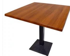
Imagen de carácter ilustrativa