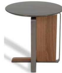
Imagen de carácter ilustrativa