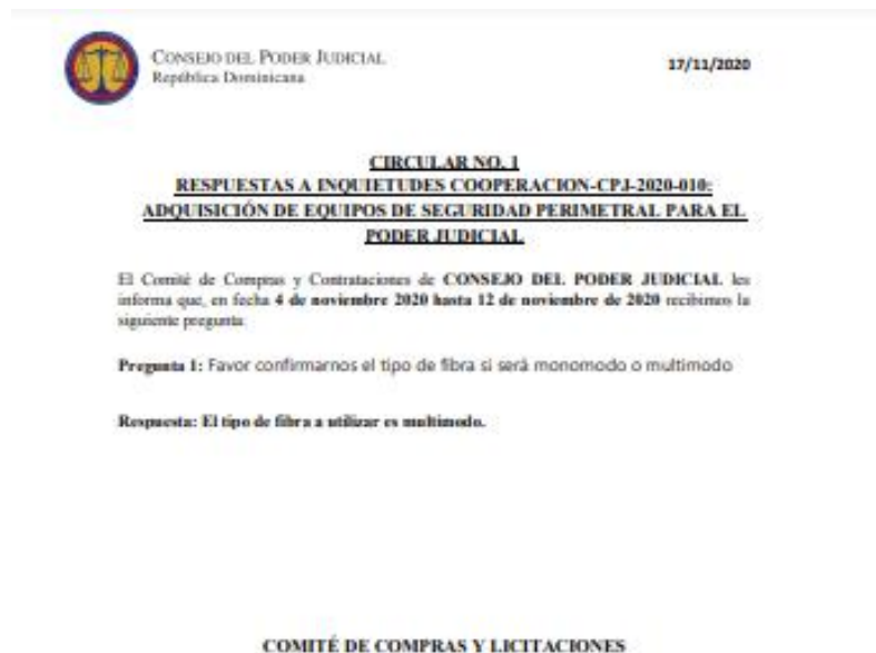
Ilustración 3 Circular núm. 1 Cooperación-CP-CPJ-2020-10

RESULTA (5): En el periodo para realizar consultas por parte de los interesados comprendido entre el cuatro (4) de noviembre al doce (12) de noviembre de dos mil veinte (2020), la Gerencia de Compras y Contrataciones recibió la siguiente pregunta: “ Favor confirmarnos el tipo de fibra si será monomodo o multimodo ”, la cual fue contestada en fecha diecisiete (17) de noviembre del dos mil veinte (2020) mediante circular núm. 01.