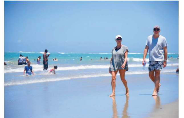
Turistas caminando en una de las playas de Puerto Plata.

mejora de la conectividad aérea y la recuperación de las economías de China y otros países asiáticos explican su pujanza.