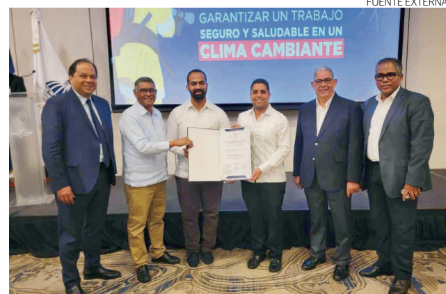
El Ministerio de Trabajo otorgó el galardón a la empresa.

Recientemente, el grupo empresarial celebró la "Se-