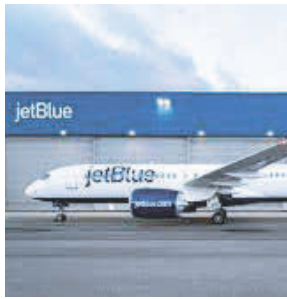
Las protestas de los dominicanos con JetBlue se mantienen.

la reunión será "drástica", ya que van a inquirirle a JetBlue una explicación contundente sobre las constantes quejas de los pasajeros.