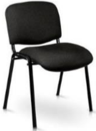
Imagen de referencia para forma y tipo; color ver descripciones.