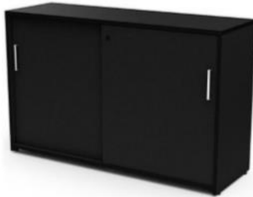
Imagen de referencia para forma y tipo; color ver descripciones.