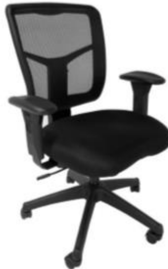
Imagen de referencia para forma y tipo; color ver descripciones.