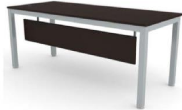
Imagen de referencia para forma y tipo; color ver descripciones.