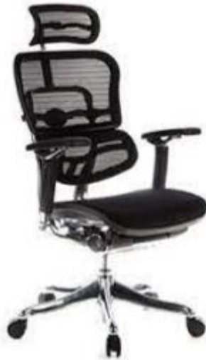
Imagen de referencia para forma y tipo; color ver descripciones.