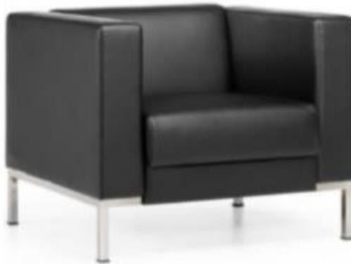
Imagen de referencia para forma y tipo; color ver descripciones.