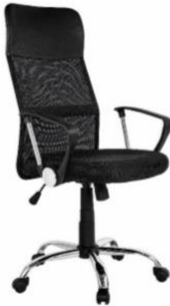
Imagen de referencia para forma y tipo; color ver descripciones.