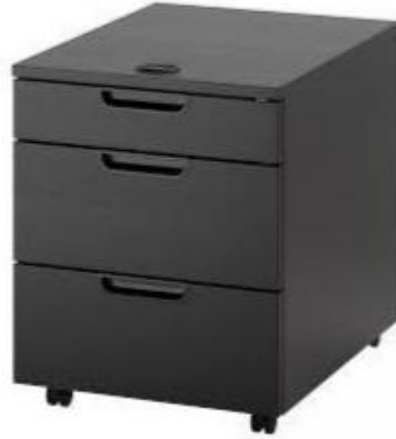
Imagen de referencia para forma y tipo; color ver descripciones.