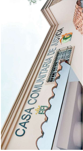
La organización sin fines de lucro trabaja con entidades públicas y privadas. F.E.

usuarios de los sectores vulnerables al mico al Estado, a los usuarios y al sector recibir servicios gratuitos en las CCJ, empresarial", señala el informe.