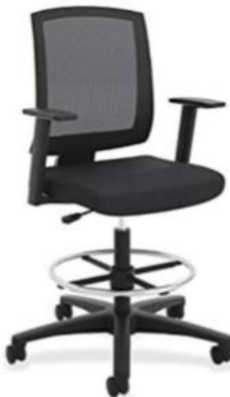
Imagen de referencia para forma y tipo; color ver descripciones.