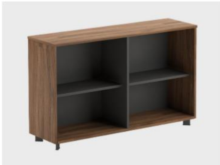
Imagen de referencia para forma y tipo; color ver descripciones.