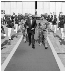
El mandatario dominicano saldrá a las 11:00 a.m.

La Presidencia dominicana informó que la salida está prevista para las 11:00 a.m. en vuelo directo hacia Washington, a donde llegará cerca de las 3:00 de la tarde. No especificó el ae-