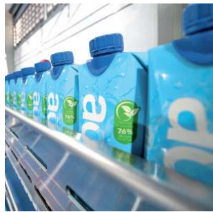
Agua envasada en cartón.

"A nivel de calidad de agua vamos a competir con el más alto nivel de las que se importan en el país a un bajo precio y la única alternativa en cartón", dijo Prieto. Además, personalizarán las marcas de las empresas. ● ELIANA LEDESMA