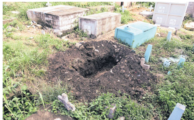
Yerbas y tumbas deterioradas abundan en el camposanto.