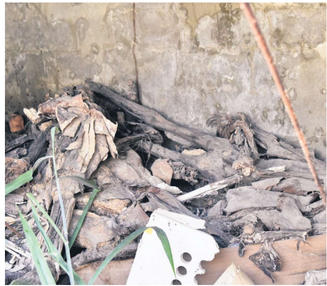
Huesos humanos expuestos a la vista de todos en el cementerio Cristo Redentor.

Un empleado se quejó de que algunos de los familiares desde que entierran a su ser querido se olvidan de visitar las tumbas y de limpiarlas.