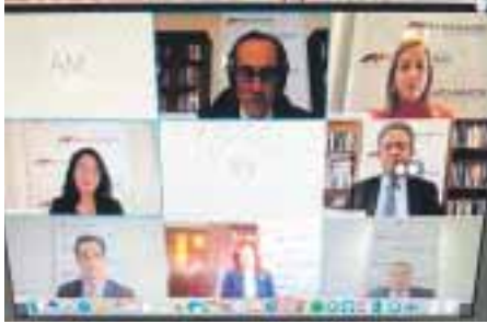
La participación se realizó de manera virtual. EXTERNA /

Al participar como invitado en el ciclo de conferencias que ha organizado la Cámara Americana de Comercio con los candidatos presidenciales, el ex mandatario considero que República Dominicana deberá recibir recursos del exterior para poder reactivar su economía, que al igual al mundo, estará seriamente afectadas por los efectos del Covid 19.