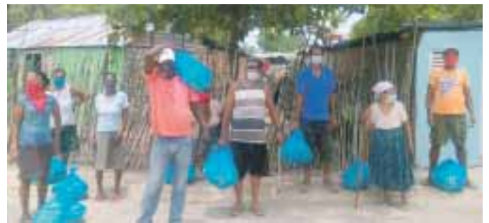
La donación incluyó 1,200 raciones alimenticias a familias vulnerables.