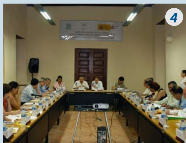
Segunda Ronda de Talleres de Expertos/as 21 al 22 de septiembre de 2005, Cartagena de Indias, Colombia.