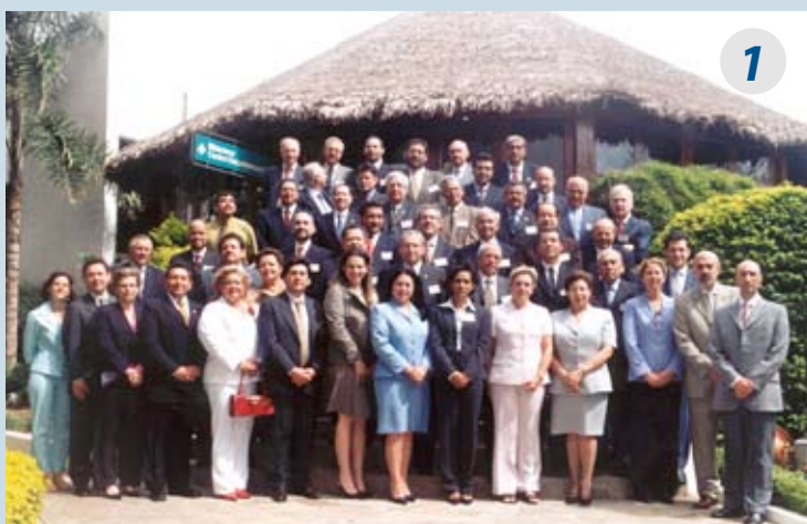
Primera Reunión Preparatoria de Coordinadores/as Nacionales 8 al 10 de marzo de 2005, Santa Cruz de la Sierra, Bolivia.