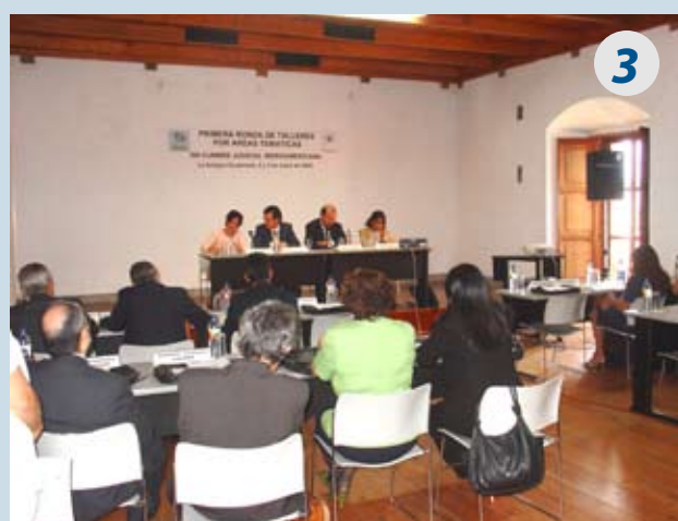
Primera Ronda de Talleres de Expertos/as 4 y 5 de mayo de 2005, La Antigua, Guatemala.

Fuente: Normas de Funcionamiento de la Cumbre Judicial Iberoamericana.