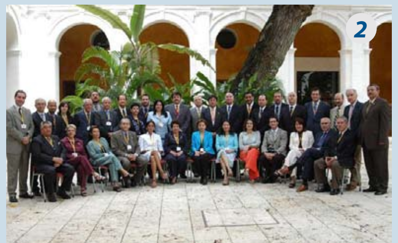
Segunda Reunión Preparatoria de Coordinadores/as Nacionales 2 al 4 de noviembre de 2005, Cartagena de Indias, Colombia.