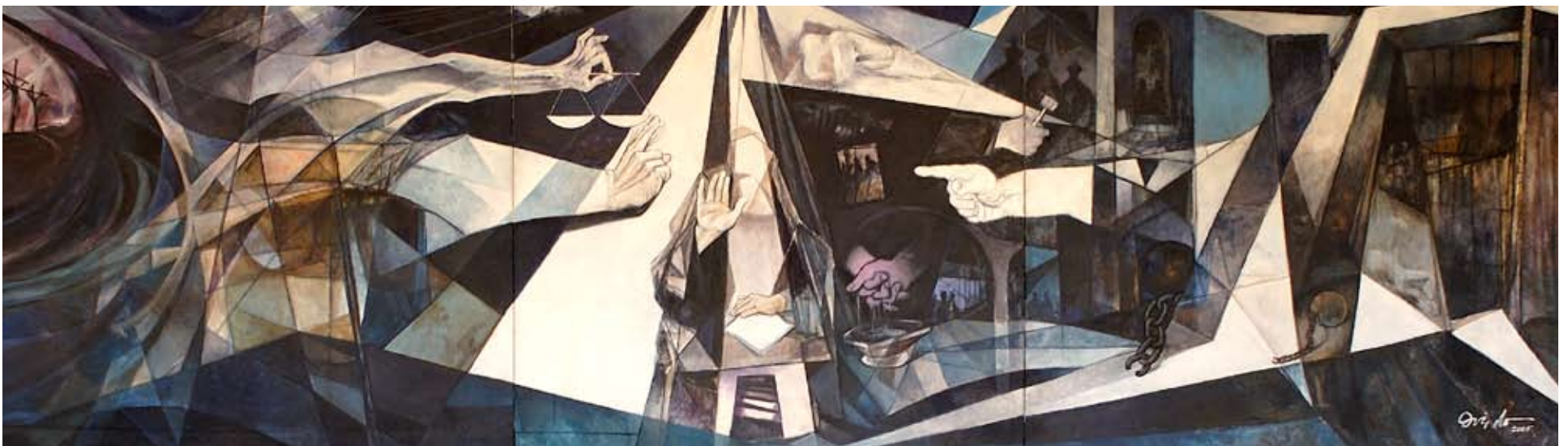
Las fotos muestran los murales que presiden la Cámara Civil y la Sala Augusta en la sede de la Suprema Corte de Justicia de la República Dominicana, que representan diversos aspectos de la Justicia.