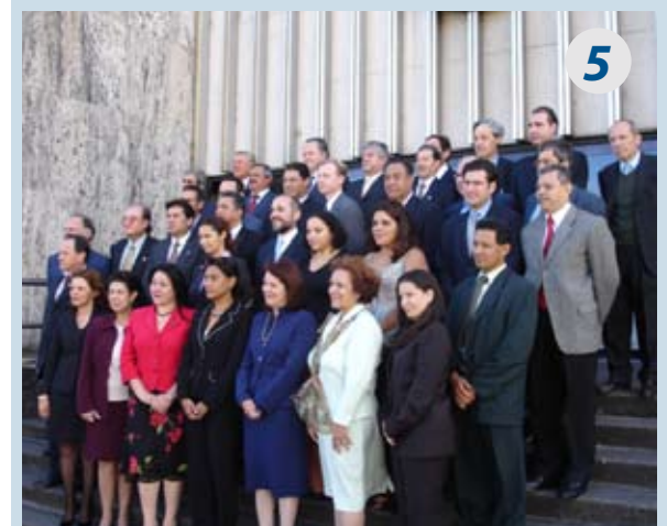
Tercera Ronda de Talleres de Expertos/as 1, 2 y 3 de marzo de 2006, San José de Costa Rica.