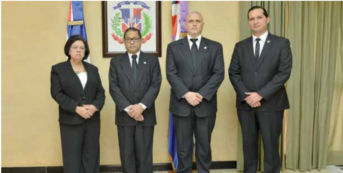
Integrantes del Consejo del Poder Judicial.

El Consejo del Poder Judicial (CPJ) ordenó la celebración de una Cumbre Judicial Nacional, con la participación de los diversos sectores que convergen en la sociedad dominicana, con el propósito de escuchar propuestas de mejoras puntuales en el sistema de administración de justicia.