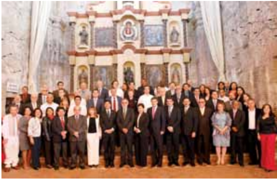
Participantes en el Primer Encuentro Sobre el Futuro de la Justicia en Mesoamérica: Prioridades y Metas, organizado por la COMJIB.