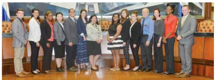
Una delegación de estudiantes de Derecho de la Universidad de Creighton, Nebraska, Estados Unidos, visitó la Suprema Corte de Justicia para conocer sobre el funcionamiento de la judicatura en República Dominicana.