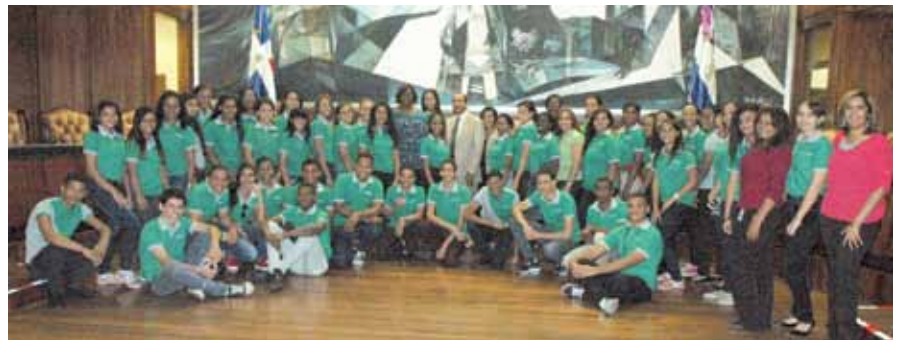
Estudiantes meritorios de la provincia La Romana, participantes del II Maratón del Conocimiento Estudiantil y el Festival de La Voz "Avanzada Estudiantil Romanense" (AVERO), La Romana 2016, visitaron la Suprema Corte de Justicia, con el objetivo de conocer su funcionamiento e instalaciones.