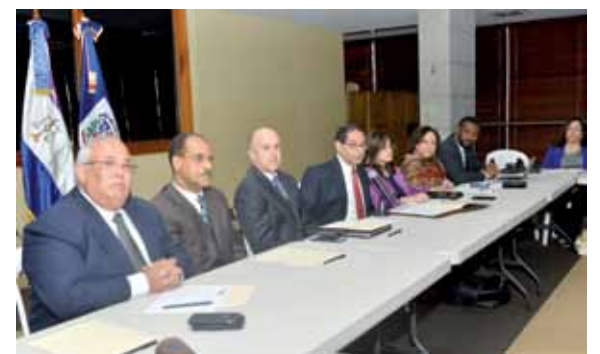
En el encuentro encabezado por el doctor Germán Mejía y el procurador Domínguez Brito, participaron presidentes de Cortes de Apelación, procuradores generales de Cortes y directores regionales de Defensa Pública.

El presidente de la Suprema Corte de Justicia (SCJ) y del Consejo del Poder Judicial (CPJ), doctor Mariano Germán Mejía, y el Procurador General de la República, Francisco Domínguez Brito, encabezaron una mesa de trabajo donde analizaron diversos aspectos con el objetivo de fortalecer la labor del sistema de justicia.