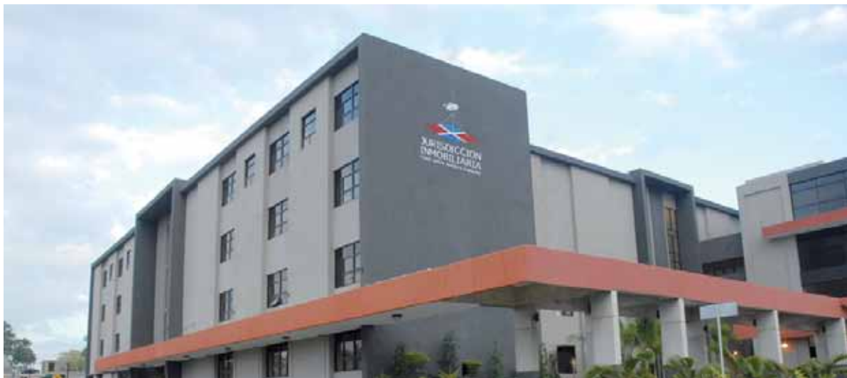
Jurisdicción Inmobiliaria del Poder Judicial.

El Consejo del Poder Judicial (CPJ) aprobó la modificación del Reglamento de los Tribunales Superiores de Tierras (TST) y de Jurisdicción Original de la Jurisdicción Inmobiliaria, en el cual dispone la implementación de salas y la realización de sorteos aleatorios en la distribución de los expedientes.