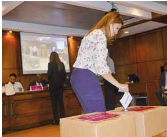
El proceso fue observado por miembros de la sociedad civil.