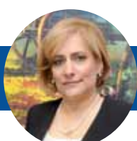
Magistrada Esther Agelán Casasnovas

El objetivo es la adopción de proyectos y acciones concertadas, desde la convicción de que la existencia de un acervo cultural común constituye un instrumento privilegiado que, sin menoscabo del necesario respeto a la diferencia, contribuye al fortalecimiento del Poder Judicial y del sistema democrático.