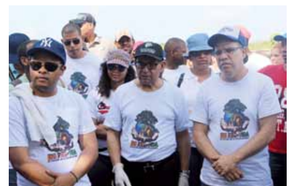
La jornada de reforestación fue coordinada por la Escuela Nacional de la Judicatura.