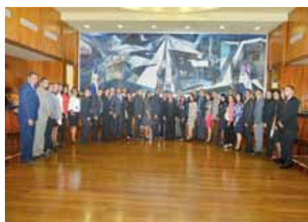
Los aspirantes a defensores públicos reciben su formación en la Escuela Nacional de la Judicatura.