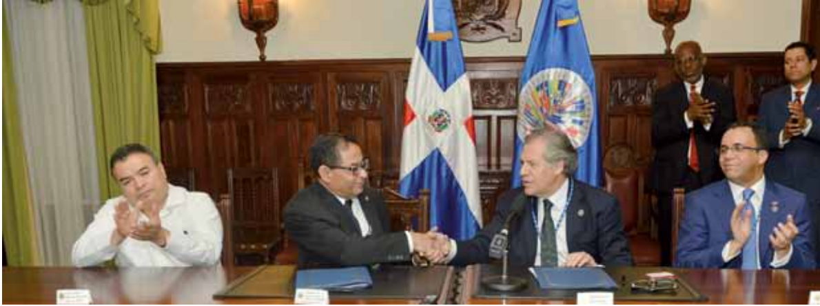
El acuerdo fue suscrito durante una ceremonia realizada en la Cancillería, con la presencia del canciller Andrés Navarro, jueces de la SCJ, funcionarios judiciales, diplomáticos y otras personalidades.