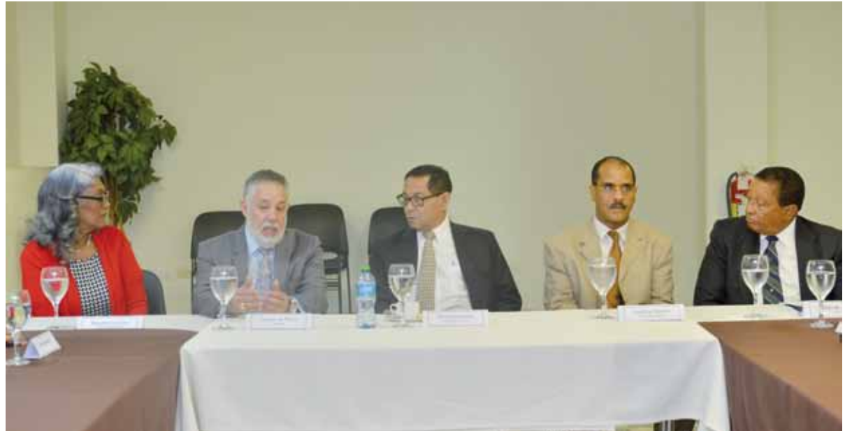
La iniciativa busca fortalecer la Jurisdicción Inmobiliaria.