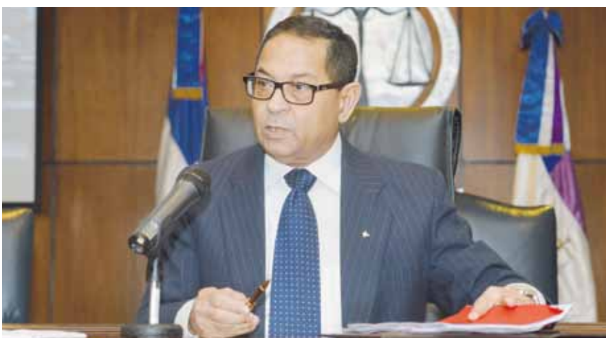
Las medidas forman parte de la política de colaboración entre el Ministerio Público y el Poder Judicial.

El Consejo del Poder Judicial (CPJ) aprobó la desconcentración de las labores del sistema de administración de justicia en el Departamento Judicial de Santo Domingo, con el propósito de aumentar los niveles de eficiencia y agilización de los procesos ventilados por los tribunales en esa demarcación.