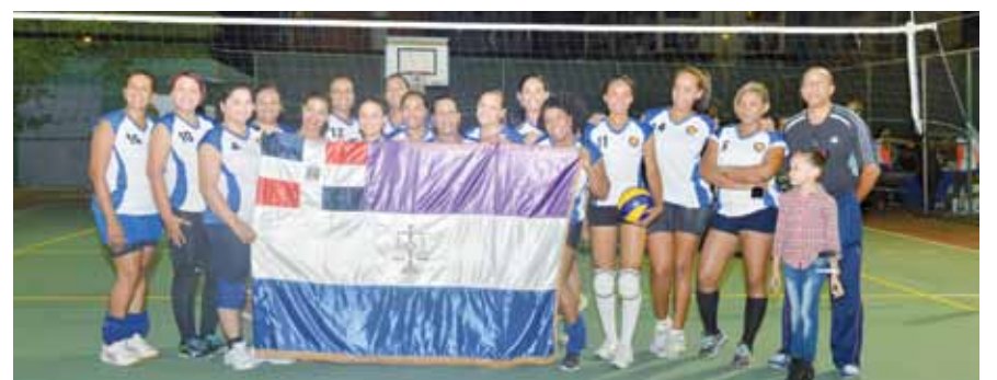
El equipo de la SCJ compitió en la categoría D frente a los Pandora, Body Shop, New Horizons y Naco.

El equipo femenino de voleibol de la Suprema Corte de Justicia resultó ganador del primer lugar durante el Torneo de Voleibol de Sala Femenino Empresarial, realizado en el Club Deportivo Naco, de la Capital.