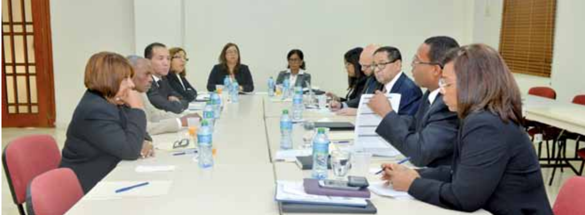
El Objetivo de las Comisiones de Seguimiento es mejorar el servicio de justicia en los departamentos judiciales.

La Comisión Regional de Seguimiento al Sistema de Administración de Justicia de Puerto Plata realizó una sesión de trabajo, la cual fue encabezada por el presidente de la Suprema Corte de Justicia (SCJ) y del Consejo del Poder Judicial (CPJ), doctor Mariano Germán Mejía.