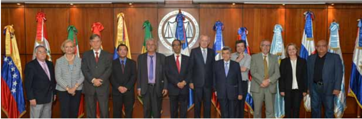
La VI Jornada Iberoamericana de Derecho de Trabajo y de la Seguridad Social aglutinó a expertos en el área de derecho laboral de 14 países.

Catorce países eligieron al ex vicepresidente de la República, doctor Rafael Alburquerque, como nuevo presidente de la Academia Iberoamericana de Derecho del Trabajo y la Seguridad, para el período 2016-2019.