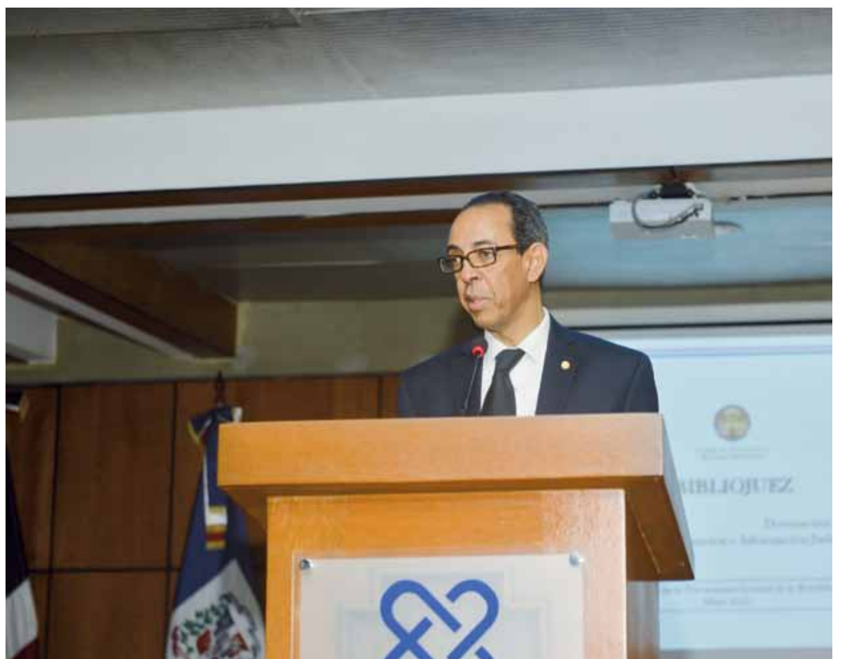
“Bibliojuetz” es una herramienta tecnológica que dará apoyo documental a jueces y juezas.