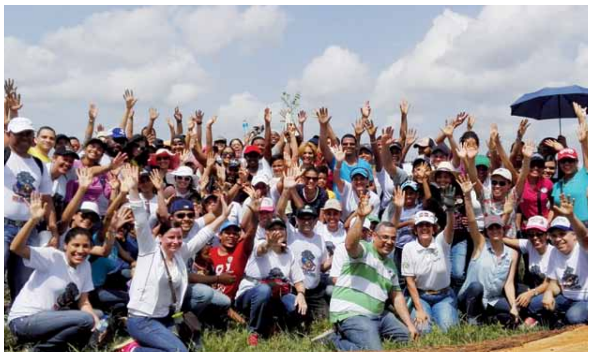
Durante la jornada fueron sembradas más de 2 mil plantas de cedro.

El Poder Judicial ha asumido como política pública apoyar los programas de reforestación, consciente de la importancia de preservar los recursos naturales para beneficio de las actuales y futuras generaciones.