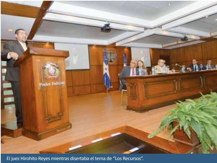
El juez Hirohito Reyes mientras disertaba el tema de “Los Recursos”.

“La reforma de cualquier instrumento para la administración de justicia, debe implicar una labor de conjunto para que el resultado no sea una especie de collage, donde se pegan diferentes elementos con la pretensión de un cuadro armónico que a veces no se logra”.