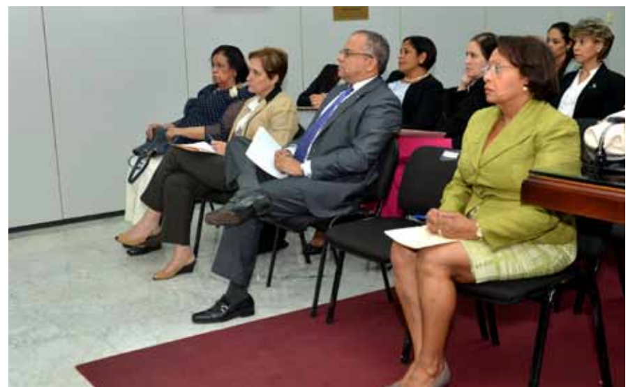
Jueces de la Suprema Corte de Justicia y de Corte, así como abogados y abogadas ayudantes, durante su participación en el taller “Ética y Argumentación”.