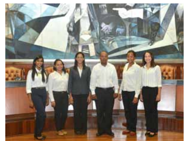
Un grupo de estudiantes de Derecho de la Universidad Pedro Henríquez Ureña (UNPHU) visitó la Suprema Corte de Justicia, con el propósito de conocer las instalaciones donde el máximo órgano judicial del país ejerce sus funciones.