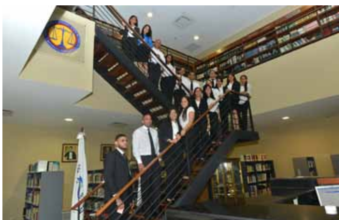
En el marco de su formación como abogados y abogadas, un grupo de 20 estudiantes de derecho de la Universidad Católica Tecnológica del Cibao (Ucateci), visitó la Suprema Corte de Justicia.