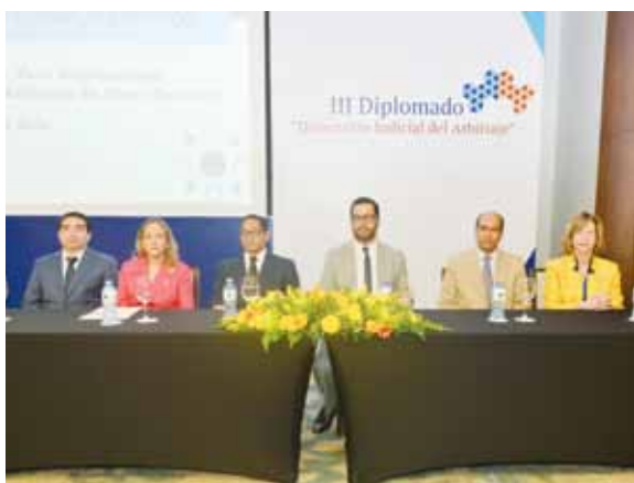
El diplomado tiene como finalidad especializar a los profesionales del ámbito judicial en temas de resolución de conflictos.

El presidente del Poder Judicial, doctor Mariano Germán Mejía, encabezó la apertura del III Diplomado sobre "Dimensión Judicial del Arbitraje", organizado por la Escuela Nacional de la Judicatura y el Centro de Resolución Alternativa de Controversia de la Cámara de Comercio y Producción de Santo Domingo.