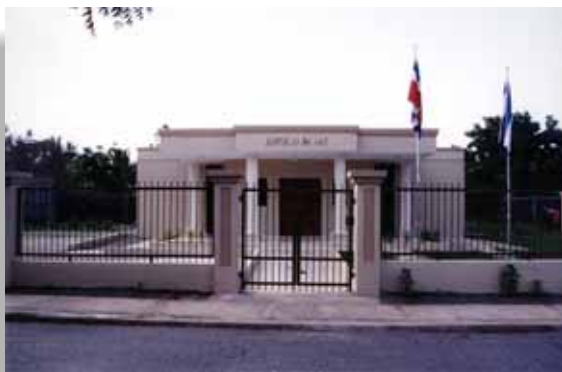
Sede del Palacio de Justicia de Mao, Valverde, inaugurada en el 2003.

Igualmente la construcción y remodelación de las siguientes obras: construcción de los Juzgados de Paz de Hondo Valle, Las Matas de Farfán, actualmente están en proceso de mejora El Valle y Sabana de la Mar, Palacios de Justicia de Higüey y La Romana.