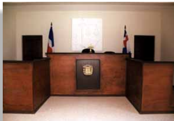
Interior de la sala de audiencias del Juzgado de Paz de Bánica, inaugurado este año.