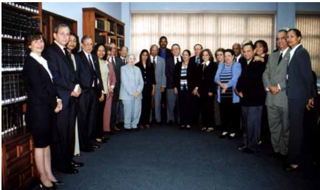
Visita de la primera promoción de Defensores Judiciales al Pleno de la Suprema Corte de Justicia.

Estas dependencias comenzaron a recibir un gran cúmulo de expedientes, lo cual se traduce en el servicio por excelencia para facilitar el acceso y la