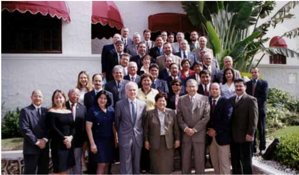
Más de 50 delegados de diferentes países participaron en la II Reunión Preparatoria de la VIII Cumbre Iberoamericana de Presidentes de Cortes Supremas y del IV Encuentro Iberoamericano de Consejos de la Judicatura.