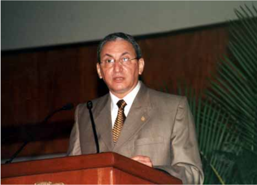
Magistrado Subero durante su discurso en la IV Conferencia del Poder Judicial.

A los fines de continuar con este esfuerzo para el fortalecimiento de sus lazos con la sociedad, la Suprema Corte de Justicia celebró el 17 de octubre la IV Conferencia del Poder Judicial con el tema “La Justicia y los Medios de Comunicación: La Construcción de la Noticia Judicial”.