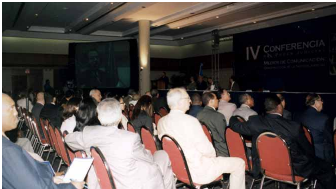
La IV Conferencia del Poder Judicial "La Justicia y los Medios de Comunicación: La Construcción de la Noticia Judicial", celebrada el 17 de octubre del 2003, reunió a jueces, abogados y comunicadores sociales del país.